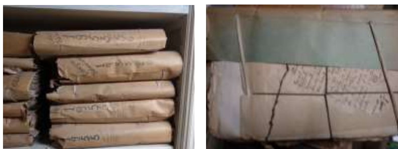
Imagen 4. Legajos de Alumnos. Paquetes, en algunos casos atados.

Los paquetes fueron considerados como un elemento, contienen una cantidad variable de carpetas, hojas sueltas, planillas, etc.