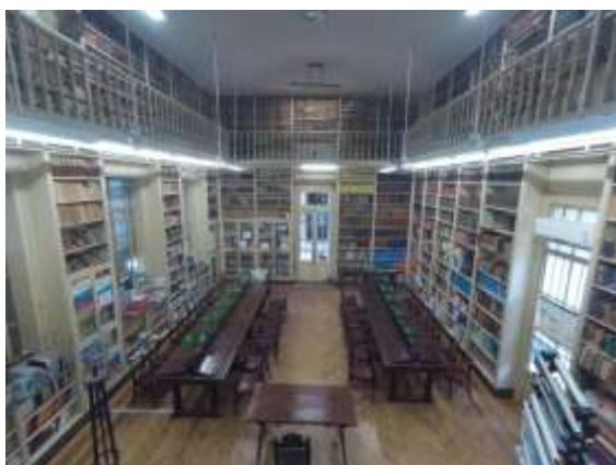
Imagen 1. Biblioteca del Colegio Nacional "San Martín". Corrientes. Argentina