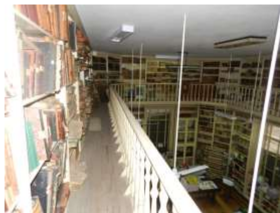
Imagen 2. Espacio donde se almacena documentación del CNGSM, sobre Biblioteca

En relación a la disociación, queda en evidencia la definición como “ la tendencia natural de los sistemas ordenados a deshacerse a lo largo del tiempo ” (Waller, 2009, p1) y se verifica la imposibilidad de recuperar objetos, debido a la falta de información sobre los mismos. Si bien no es un agente que afecte el estado físico, la falta de mantenimiento ha ocasionado la acción biológica y de contaminantes (polvo)