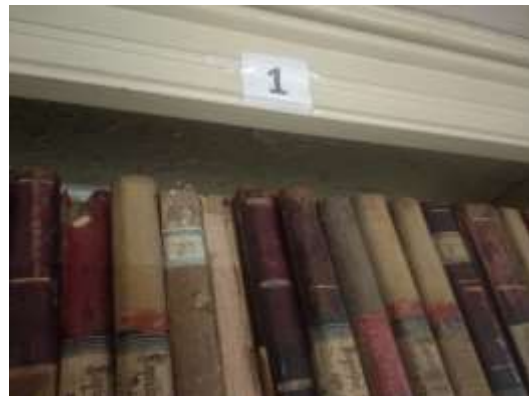
Imagen 3. Señalización provisoria de estanterías

Luego esos datos fueron cargados en hojas de cálculo de Excell, para poder analizarlos, en especial lo referido a cuantificación de las distintas tipologías documentales. Como sub-serie se consideró el nombre que aparece impreso o escrito en ellos. En otra etapa se agruparán las series documentales, con la participación de los archivistas que integran los PI y PE.