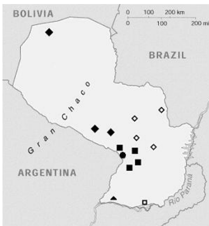
Fig. 4:- Distribución del género en el Paraguay: M. paraguayensis sp. nov. (◻), Localidad tipo (●). M. atroluteus (?). M. klappenbachi (◆). M. fulvoguttatus (◇). M. cupreuscapularis (? )