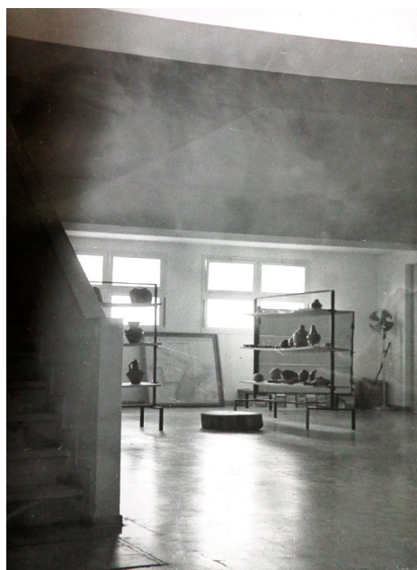
Figura Nº 1. Instalaciones iniciales del Museo Regional de Antropología.