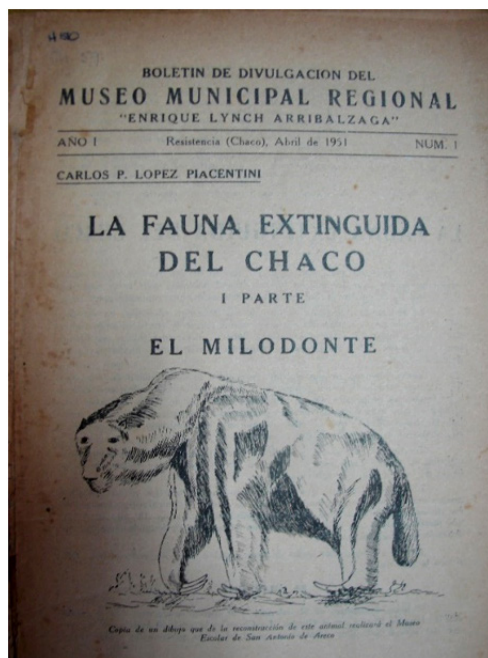
Figura N° 1. Primer número del boletín informativo publicado por el Museo Municipal Regional Enrique Lynch Arribálzaga, con nota de López Piacentini, en abril de 1951.

distribución es completamente gratuita. El contenido de la divulgación normalmente se encontraba en el reverso de la portada y continuaba hasta la contratapa.