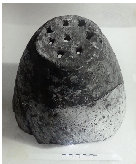
Figura N° 4. Cántaro para filtrar agua. Período hispano-indígena.

*** Evidencia de actividades de molienda de granos propio de etnias que ya habían adoptado cierto grado de agricultura (Morresi, 1983: 414).