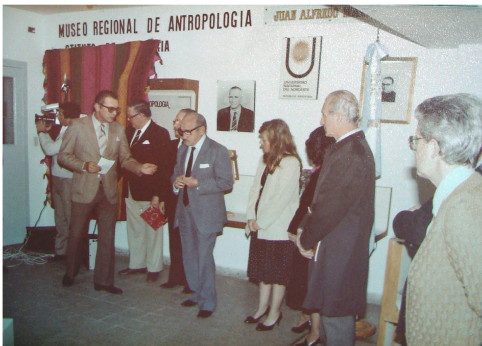
Figura N° 5. Inauguración del Museo Regional de Antropología.