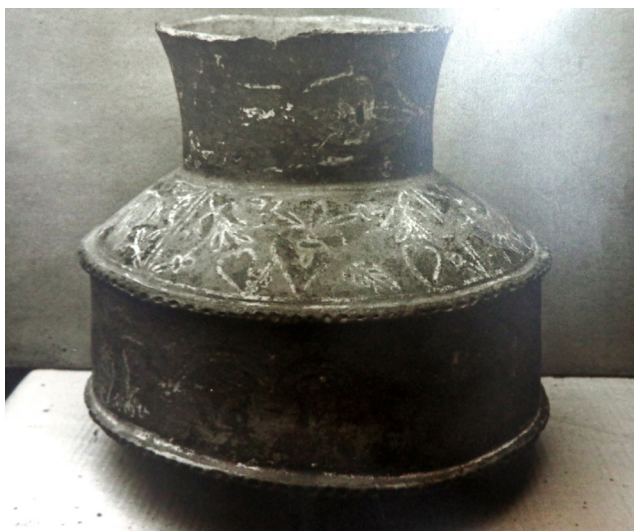
Figura N° 3. Cántaro hispano-indígena de singulares características.

Este material arqueológico constituye, para Morresi, un muestrario del contacto hispano-indígena. Los vestigios arqueológicos permiten recrear la presencia española en la región del Chaco a partir de los objetos recuperados en las Ruinas del Km 75, siendo su mayor aporte la significatividad que adquieren a partir de su identificación con la antigua ciudad de Concepción del Bermejo 9 . Por ello, aun cuando reconoce que no existen acuerdos en la periodización, Morresi propone ubicarlos cronológicamente en el Primer Período Histórico Temprano Hispano-Indígena. El material recuperado se sistematiza cronológicamente en indígena, hispano-indígena e hispánico; su convivencia se comprueba in situ durante la excavación (Morresi, 1983).