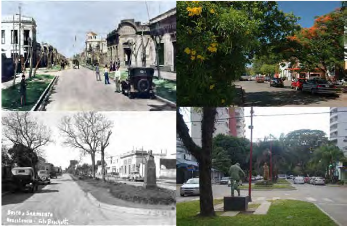
Imagen 2: El espacio público mantiene sin cambios sus dimensiones y características iniciales, aun cuando la ciudad en el área central ha cambiado la altura de las edificaciones.