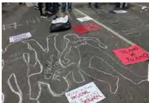
Figuras 1 y 2. Marcha nacional Ni Una Menos . Intervención artística en el espacio público. (Resistencia, 03 de junio de 2015. Foto: Marcha de lxs Putxs Chaco-Corrientes ).

A este modo manifestarse por parte de la agrupación decidí denominarla Femicitazo porque adopta la acción artística del Siluetazo y lo vinculan con un contexto social en el cual visualiza y repudia los femicidios que acontecieron en Argentina. De modo que se puede decir que esta acción realizada por el grupo es arte político siguiendo a López Aparicio (2016) porque presenta una propuesta con el fin de visibilizar y sobre todo interpelar a lxs espectadorxs con la problemática planteada. Es decir que La Marcha de lxs Putxs a través de sus observaciones y reflexiones sobre el contexto realizó un acto artístico cuya temática era exclusivamente social y cuya finalidad fue evidenciar el problema planteado con el fin de que se produzca un cambio en la realidad. Este modo de expresarse del grupo refleja lo que plantea el autor sobre el arte político en el cual lxs artistas utilizan el arte para intervenir ante una problemática con el fin de transformarla.