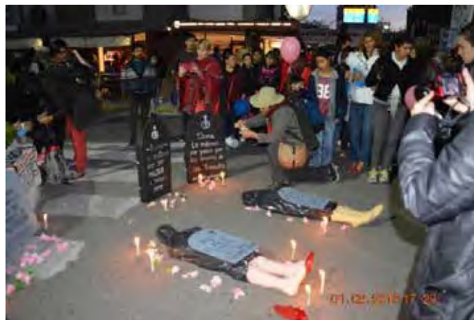
Figura 5. Integrantes del colectivo La Marcha de lxs Putxs Chaco- Corrientes interviniendo en el espacio público. (Marcha nacional Ni Una Menos, Resistencia, Chaco, 03 de junio de 2016. Foto propia).