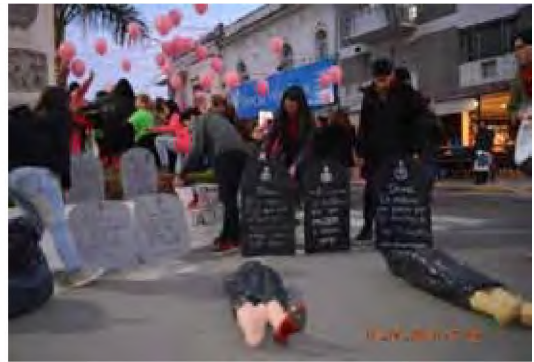
Figura 4. Integrantes del colectivo La Marcha de lxs Putxs Chaco-Corrientes interviniendo en el espacio público. (Marcha nacional Ni Una Menos, Resistencia, Chaco, 03 de junio de 2016.).