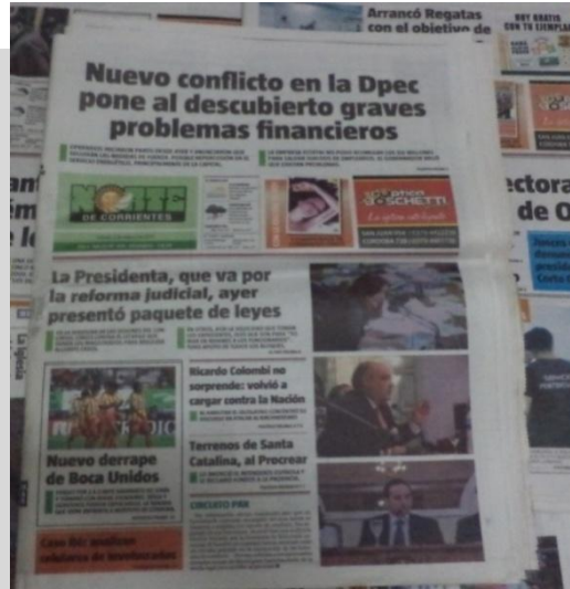
Tapa del diario Norte de Corrientes, 2 de marzo de 2013.