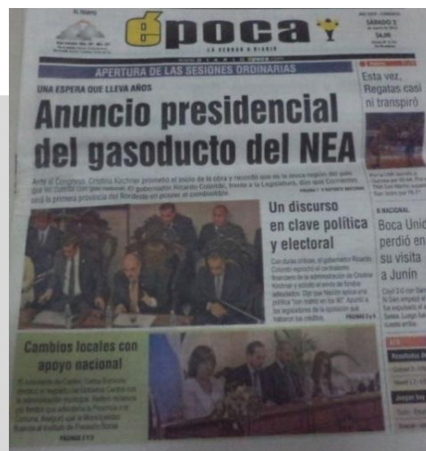
Tapa del diario Época, 2 de marzo de 2013.