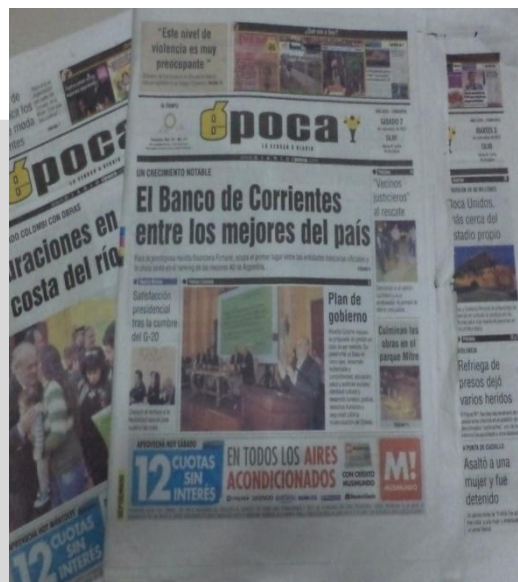
Tapa del diario Época, 7 de septiembre de 2013.