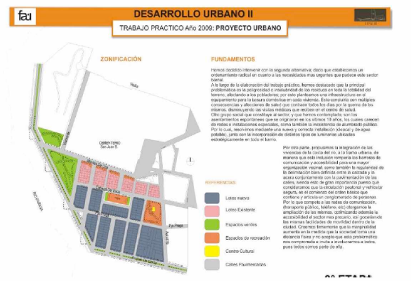
Fig. 2: Corrientes, Barrio Virgen de los Dolores. Alumnos: Acosta, Almeida, Almirón, Mozzati.