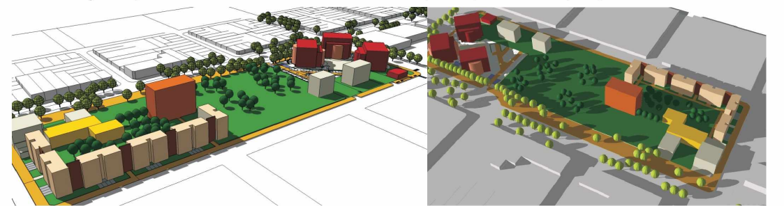
Fig 4 y 5: Propuesta de la ciudad de Resistencia. Alumnos: Espindola, Manti Lla, Silvestri. Año 2009.