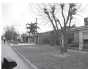
Barrio La Liguria