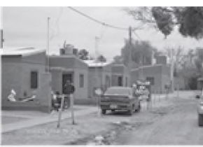
Barrio Nuevo Don Bosco