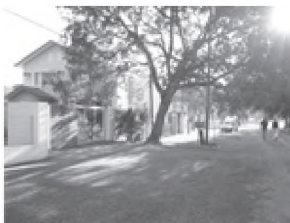
Barrio Parque Golf Club