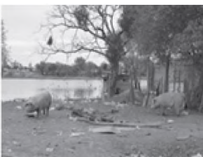
Asentamiento al borde Laguna

Imagen 2. Imágenes de sectores (unidades barriales) que componen la AUDC