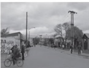
Barrio Mujeres Argentinas