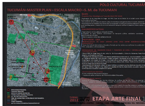
Trabajo de Alumnos, año 2012. Propuesta a nivel urbano, ciudad de San Miguel de Tucumán

Ejercicio 2012. Puesta en valor del sector urbano del ferrocarril. Diseño equipamientos culturales complementarios, San Miguel de Tucumán. El estudio de un sector estratégico de la ciudad de Tucumán y la proyección de equipamientos complementarios a escala urbana, en el marco de las potencialidades de desarrollo detectadas, implica prestar especial atención a los aspectos históricos, funcionales, formales, simbólicos y ambientales del proyecto, ubicando el comienzo del ejercicio en una prueba de creatividad arquitectónica, sin descuidar que el desarrollo final requiera que el alumno alcance la descripción constructiva del edificio, debiendo formalizar técnicamente los principales sistemas constructivos e instalaciones complementarias, como lo haría habitualmente con cualquier tema en 4.º año. Presentamos a continuación un trabajo de partido en el que mostramos la propuesta del grupo de alumnos desde lo urbano, la escala macro donde incorporan todo lo que actualmente están desarrollando en la ciudad de Tucumán como "Master Plan" y luego el desarrollo de su propuesta a nivel del sector urbano con un nivel de definición de partido arquitectónico de cada uno de los edificios propuestos.