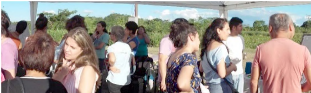
Figura 3. Mapeo colectivo realizado en el espacio donde se desarrolla el proyecto