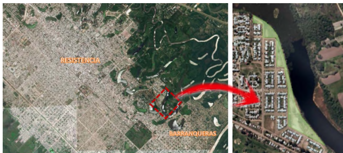
Figura 1. Plano de ubicación del sector por intervenir.

Actualmente se está finalizando la etapa de diseño del parque.