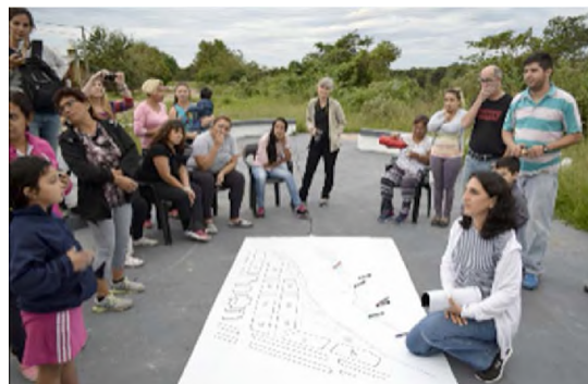
Figuras 4 y 5. Diseño colectivo del parque con los vecinos del barrio; en el piso se observa una lona con el plano del terreno donde se va a realizar el parque.

el Instituto Provincial de Desarrollo Urbano y Vivienda y el Ministerio de Desarrollo Urbano y Ordenamiento Territorial de la Provincia del Chaco. 2. La conformación de grupos de trabajos específicos: grupo de comunicación, encargado de elaborar el sistema de comunicación entre los distintos participantes del proyectos y entre el proyecto y el medio; grupo terrenos, encargado de definir la propiedad de los terrenos destinados al espacio público y los trámites para que pasen a dominio público y el tercer grupo, destinado a organizar las tareas del diagnóstico participativo. 3. Utilización de técnicas desde una perspectiva participativa, en la etapa