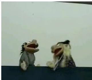
Imágenes de la clase y la dramatización con títeres.