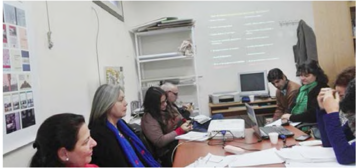
Figuras 2 y 3. Algunos de los encuentros del seminario con los docentes de ambas cátedras

A partir de este primer seminario se pudieron reinterpretar los textos que habitualmente son utilizados en Historia y Crítica I y II, reflexionando sobre los conceptos que de ellos se derivan, y se pudo diferenciar aquellos libros meramente informativos de los que permiten además extraer nociones instrumentales para el análisis y el hacer arquitectónico. Al mismo tiempo, los conceptos obtenidos ser-