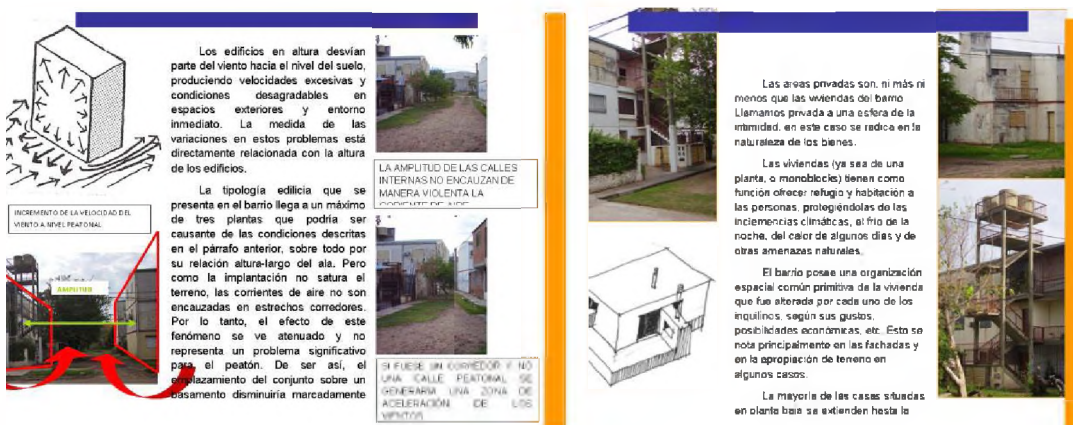
Gráficos de T. P. alumnos cátedra T. D. II

Los siguientes aspectos subjetivos se tuvieron en cuenta a partir del relevamiento. La persona que llega al barrio como observador va descubriendo "hitos" reconocibles, que permiten orientarlo en su recorrido y en la apropiación de sus distintas áreas. Se considera el territorio como el soporte donde se promueven las acciones vitales, modelizado por el medio ambiente y lo construido, lo socioeconómico y cultural. Por ello la singularidad y significación son determinantes en el estudio de cada territorio y su sociedad. El valor y apropiación social dependen de las específicas condiciones sociales y territoriales, y se constituyen en "símbolos" y "significados" de su propia cultura.