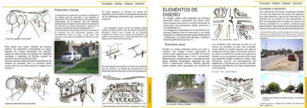
Gráficos de T.P. alumnos cátedra T.D. II