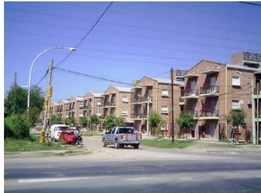
Imagen barrio Llaponagat

Difundir los resultados de la actividad de enseñanza-aprendizaje a fin de contribuir a la producción de nuevas estrategias pedagógicas en el proceso del diseño arquitectónico, para lograr aprendizajes significativos, durante la formación profesional de la carrera de Arquitectura.