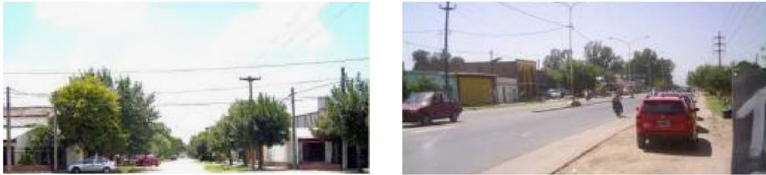
Gráficos de T. P., alumnos cátedra T. D. II

Monoblocks”, que constituye un punto nodal donde la gente se reúne. Las sendas son los conductos que sigue el observador.