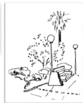
Gráficos de T. P. alumnos cátedra T. D. II