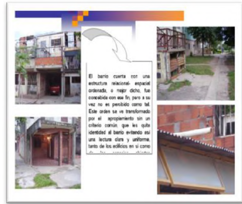
Gráficos de T. P. alumnos cátedra T. D. II

Los espacios semipúblicos o al aire libre que se dan entre las viviendas se convierten en los famosos "lugares de nadie". No poseen identidad ni significado, y son productores de ruidos y olores por el acumulamiento de basuras. Es necesario generar "espacios autosuficientes" logrando un mayor aprovechamiento de los usos del sitio, que mejorará la imagen urbana y la imagen espacio-funcional. Además, hay que prever la adaptabilidad a los factores del clima y del suelo, del loteo y amanzanamiento, para lograr diseños funcionales y con buenas resoluciones tecnológicas. Nada de esto se da en la región.