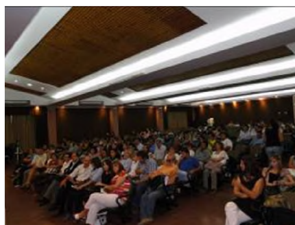
Figuras 1 y 2. Imágenes de las jornadas