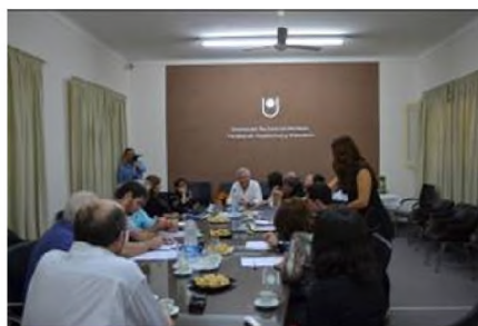
Figuras 2 y 3. Imágenes de la mesa de trabajo.