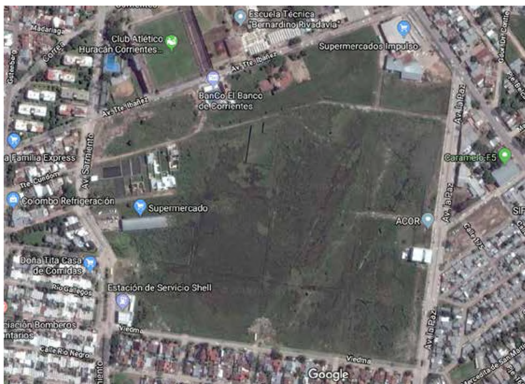
Figura 1. Ex Aeroclub de la ciudad de Corrientes capital (2018), rodeado por las avenidas La Paz, Maipú, Tte. Ibáñez, Sarmiento y la calle Viedma.

La existencia de los vacíos urbanos delimita el modo de expansión poblacional, sumada la problemática asociada a las bajas densidades que requieren un gran capital para proporcionar la infraestructura adecuada para satisfacer las necesidades