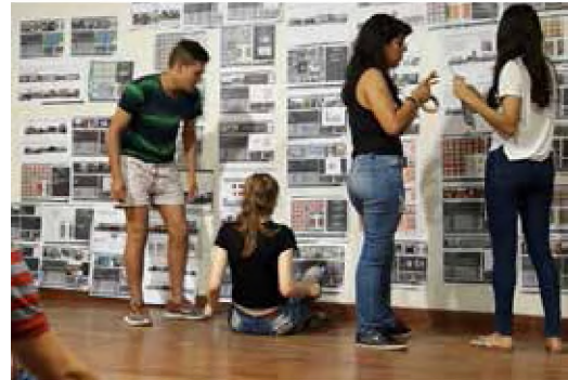
Distintos momentos de la Exposición Final de las Fichas del TP Integrador