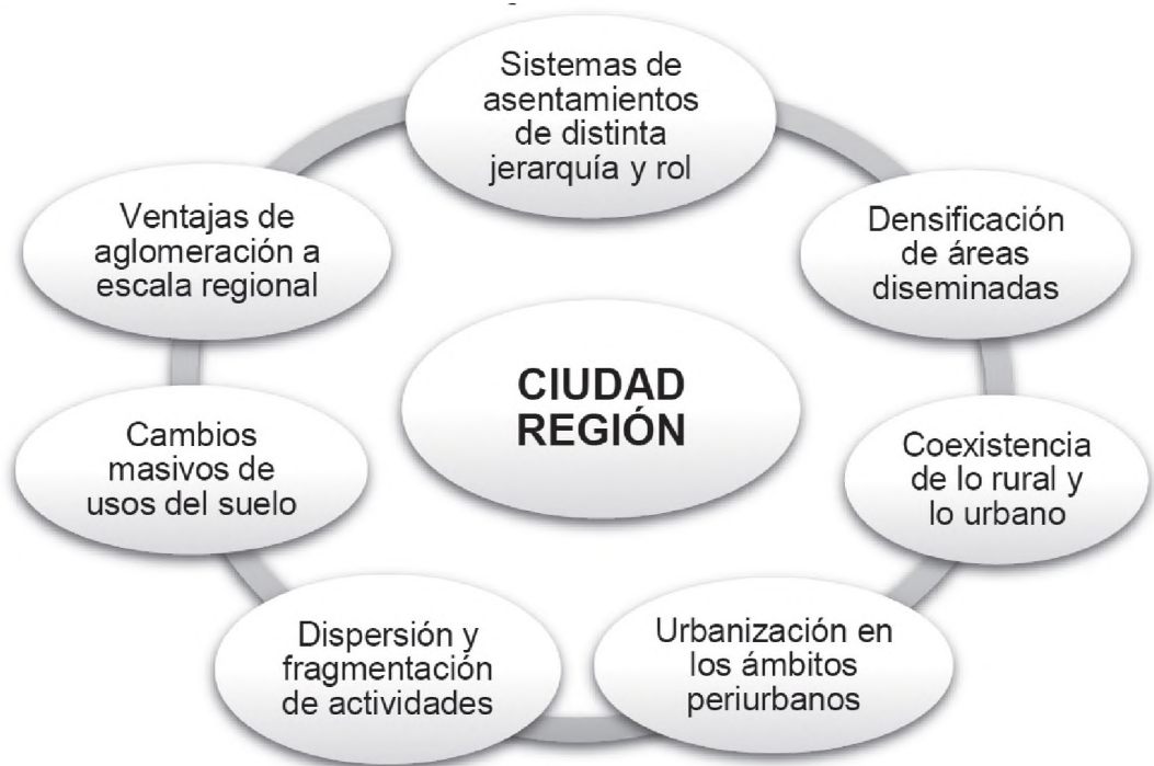
Figura 1. Rasgos esenciales de la Ciudad Región

El concepto de ciudad región fue acuñado a fines del siglo XX por autores de la geografía crítica o de la