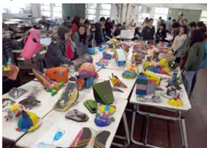
Imagen 2. Diseño Gráfico UNNE.

sino también en cuanto a la capacidad edilicia de sus universidades. Este aspecto deja ver la versatilidad con que los docentes se adecuan a trabajar en contextos de masividad.