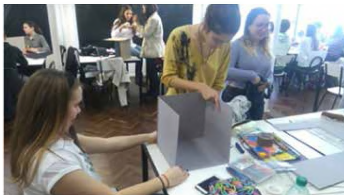
Imagen 1. Universidad de la República Montevideo.

Cabe destacar que son carreras más noveles en comparación con la carrera de Diseño Gráfico de la FAU-UNNE, con muchos menos años de experiencia en la enseñanza del Diseño que nosotros. En el caso de la carrera de la Universidad de la República en Montevideo consta de trece años de antigüedad, y en la USFXCH en Bolivia, solo dos, lo cual constituye una diferencia no solo en cuanto a cantidad de estudiantes inscriptos, modalidades de enseñanza, cantidad de docentes necesarios para cubrir la demanda,