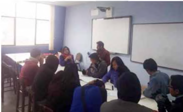
Imagen 3. USFXCH, Bolivia.