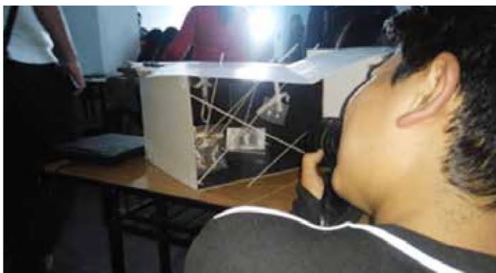
Imagen 4. Estudiantes de ambas universidades trabajando en el "Taller de composición gráfica a través de la técnica fotográfica".