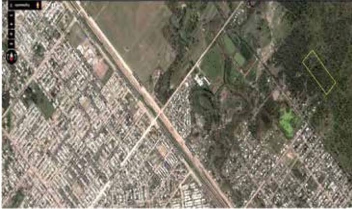
Predio ubicado sobre avenida Chaco a 1500 m de la avenida Soberanía Nacional.

aulas de capacitación, biblioteca, comedor, dormitorios para delegaciones de otras localidades que asistan a actividades de intercambio o cursos intensivos y un área para la práctica de deportes más un oratorio multicultural. Para ello la cátedra Trabajo Final de Carrera de la Unidad Pedagógica "A" requirió de las autoridades de la FAU-UNNE la formalización de un Acuerdo Marco de Cooperación y Asistencia Técnica, que permitiera aportar a la fundación anteproyectos elaborados por los alumnos del último año de la carrera de Arquitectura, y que esta, a través de sus representantes, contribuyera con la información documental del lote disponible y los datos necesarios para la elaboración del programa de necesidades requerido para la ejecución de los trabajos.