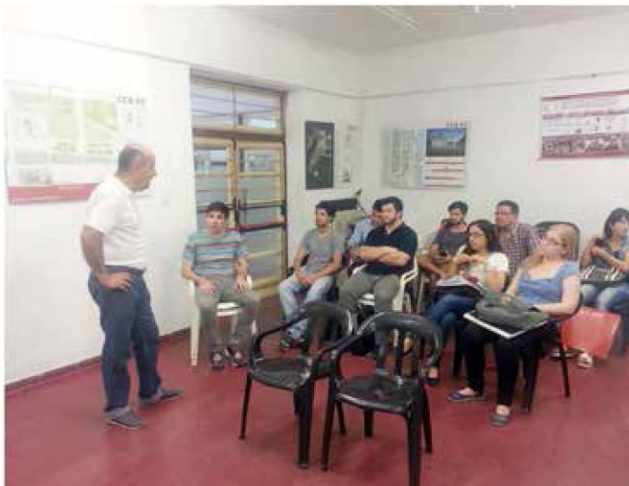
Trabajo de la cátedra con el grupo de alumnos que asumieron la responsabilidad de desarrollar el trabajo de diseñar el centro de capacitación para la Fundación Ciudad Justa. Ciclo lectivo 2015/2016.

3. Reuniones de trabajo con el comitente: fueron necesarias dos reuniones entre alumnos y comitente, con la intervención de los docentes de la cátedra, para comprender la multiplicidad de actividades que estos pretendían desarrollar en el centro de capacitación y los objetivos políticos subyacentes: articular