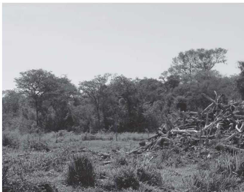
Fig. 2. Ambientes característicos del área de estudio.