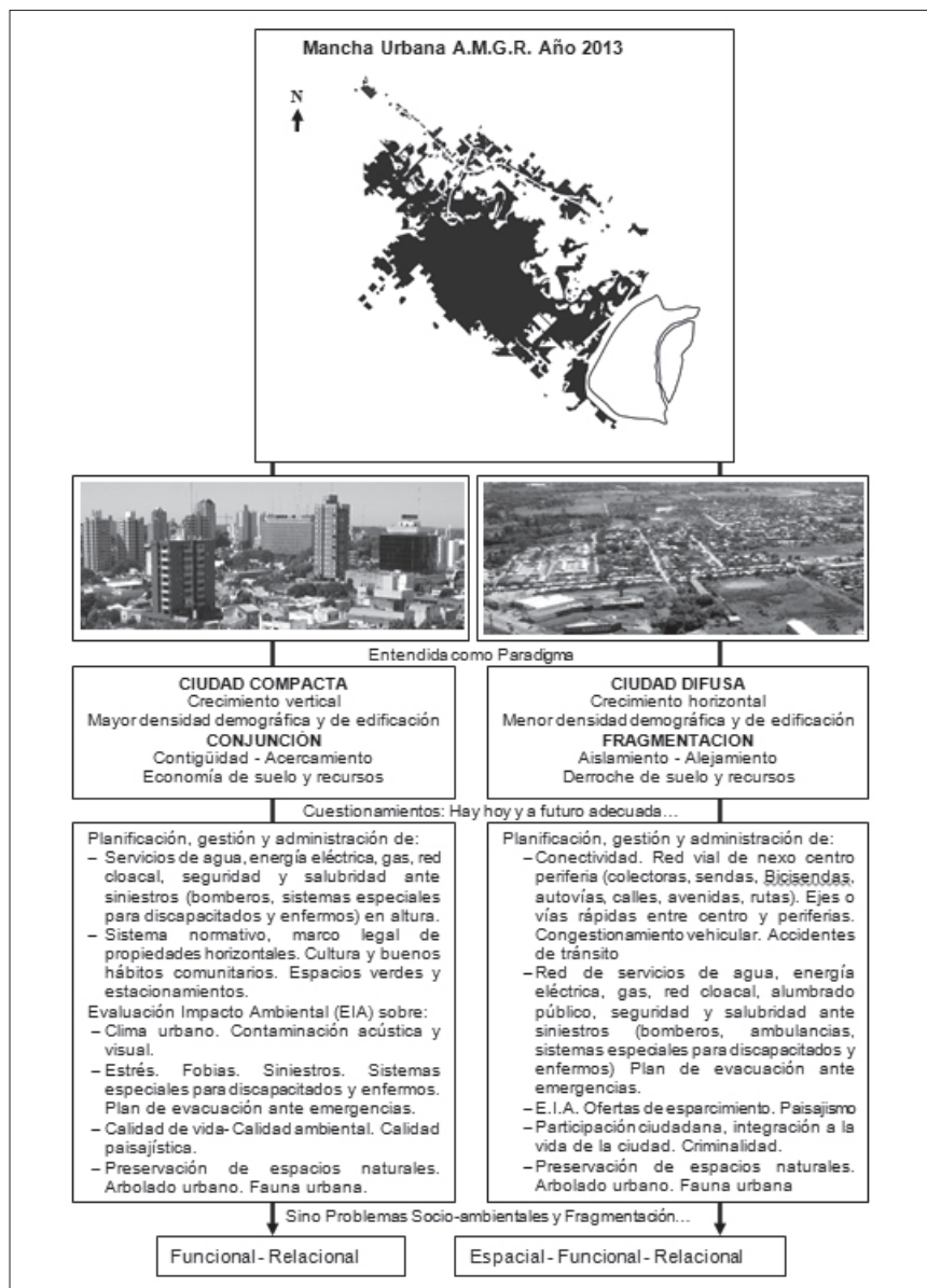
Fig. 5. Ciudad Compacta – Ciudad Difusa. ¿Qué ciudad pretendemos?