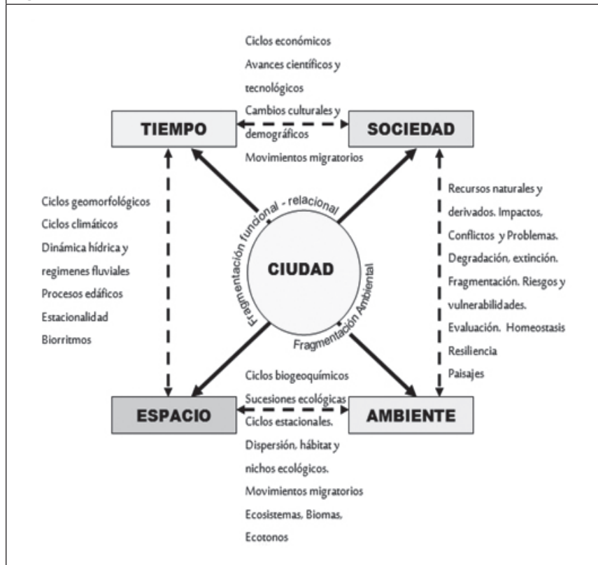
Figura 2. Ciudad, Fragmentación, Ambiente y Sociedad

En general, las ciudades de todo el mundo están hoy muy fragmentadas. Según Angel, Shlomo; Parent, Jason y Civco, Daniel L. (2010) en las zonas más urbanizadas, la segmentación de los espacios edificados por los espacios abiertos –que quedan insertos en su interior– es un atributo clave de la expansión urbana y de la propagación de la fragmentación, como también el desarrollo urbano de baja densidad es ahora otra característica universal de las ciudades. Sostienen además... estamos construyendo ciudades fragmentadas y desconectadas, interrumpidas por franjas de terrenos baldíos fraccionados; afirman también que en el proceso de urbanización, en primer lugar, la densidad con la que se construye el suelo urbano es demasiado baja y necesita urgentemente ser aumentada; y, en segundo lugar, que