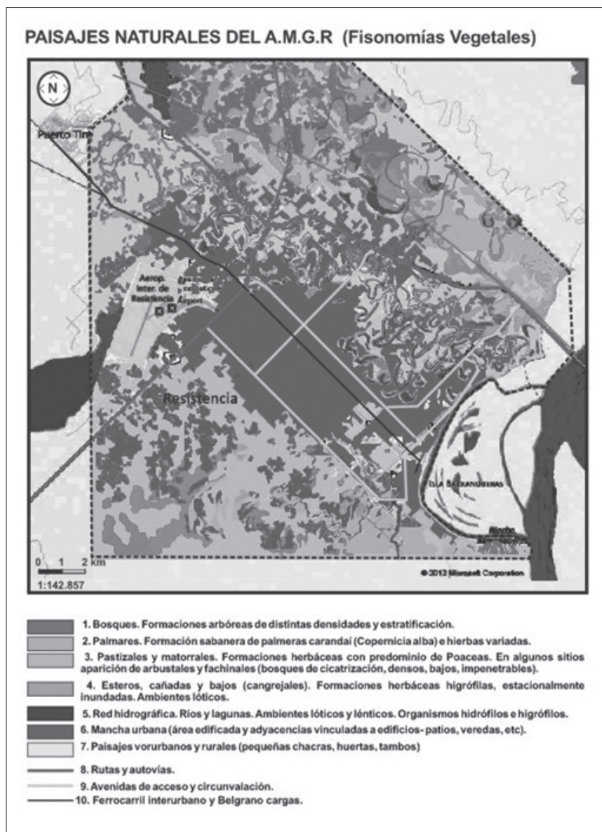
Fig. 4. A.M.G.R. Paisajes Naturales, Mancha Urbana y Grandes Ejes de Comunicación