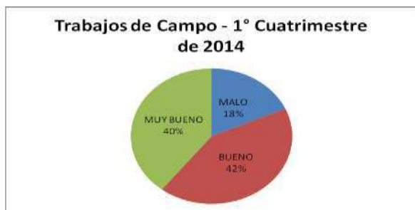
Figura 3. Distribución resultados 2014-1

Como se observa en la Figura 3, si sumamos los porcentajes correspondientes a las ponderaciones bueno y muy bueno se alcanza un 82 % de efectividad sobre los trabajos analizados.