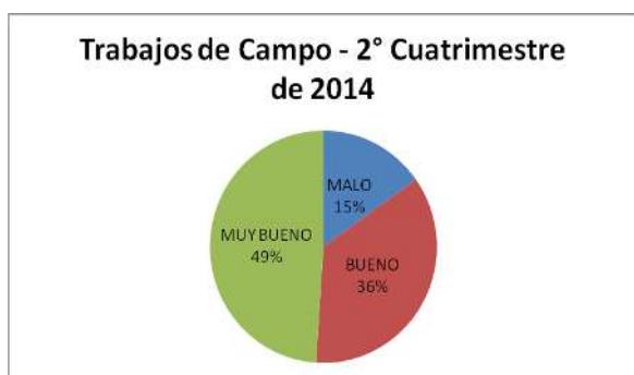
Figura 4, Distribución resultados 2014-2-

Si sumamos los porcentajes correspondientes a las ponderaciones bueno y muy bueno, observados en la figura 4, se alcanza un 85 % de efectividad sobre los trabajos analizados.