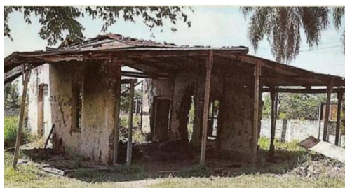
Foto 4. Casa Familiar Gernaldi. Antes de su recuperación.