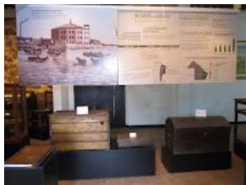
Foto 6. Sector 1. Vista panel ilustrado.

- Sector 2. Un planisferio que ilustra el viaje desde Italia a la Argentina. En la vitrina, bajo el planisferio se ubica una foto de casas italianas y del hotel de inmigrantes, Buenos Aires (Foto 7).