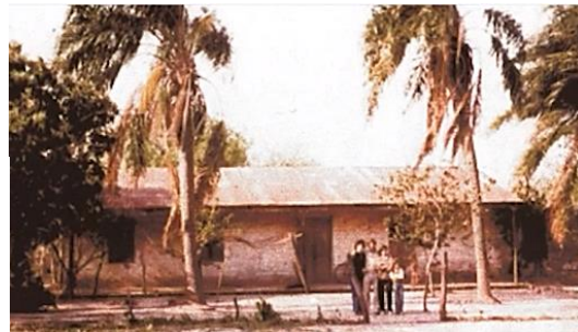
Foto 3. 1878- Vivienda Familia Geraldi.

Él mismo cconstruyó su vivienda de adobe y techo de troncos de palma ahuecados, una construcción precaria reformada con el tiempo, pero manteniendo su fisonomía original. Cuando tuvo más tarde su ladrillera, lo llevo a modificar la casa “levantando las paredes con ladrillos asentados en barro, y cambió la paja del techo por palmas”. En el año 1900 se le agregaron nuevos cimientos, paredes de ladrillos cocidos, revoque de arenilla con cal y reemplazó el techo de palma por chapas de cinc a dos aguas. También integraron el conjunto de la construcción: un galpón, un palomar y una caballeriza. (Foto 3).