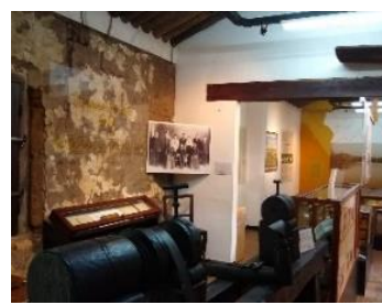
Foto 12–Foto 13. Sector 5. Vista foto Luis Geraldí y sector más antiguo de la vivienda.