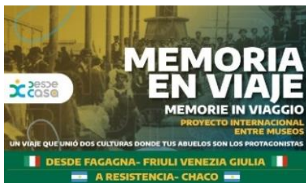
Foto 20. Proyecto Internacional.

El Museo “Geraldi” desarrolla el proyecto internacional entre museos Memoria en viaje (Memorie in viaggio), y junto al Eco-museo della Gente di Collina Il Cavalîr de Fagagna, Italia 17 . Consiste en la unión entre museos de dos continentes, países, públicos y culturas fortaleciendo los vínculos emotivos y didácticos con la sociedad italiana de la ciudad Fagagna. (Foto 20).