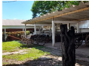
Foto 16-Foto 17. Vista herramientas agrarias y carruajes.

Así, la Casa Museo y Sitio Histórico “Luis Geraldí” como edificio arquitectónico, sitio o lugar histórico y conjunto del acervo patrimonial es el ámbito de reinterpretación de la cultura italiana y el aporte cultural para sustentar la memoria, identidad y experiencias humanas como lugar fundante de la colonia caracterizada por la inmigración italiana. Manifiesta la revalorización del inmigrante italiano dentro de la sociedad chaqueña y argentina, ubicándolo al museo como elemento constitutivo y fundante de una identidad que nos acerca a la historia de aquellos inmigrantes que en su momento desembarcaron en la colonia Resistencia, y gracias a los cuales la ciudad debe gran parte de su cultura e identidad (tradiciones, costumbres, valores, principios, etc). Esto se debe a las exposiciones (objetos originales del inmigrante), actividades, y programas que se desarrollan en el museo poniendo en valor su acervo cultural como testimonio documental, expresión de su tiempo y espacio, siendo vehículo y protección de la memoria de la comunidad, vecinos y público en general para su conservación y afirmar su permanencia en el tiempo.