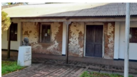
Foto 5. Casa Familiar Geraldí.

recuperación de museos y centros culturales de la provincia, el ex Gobernador D. Peppo, el Ministerio de Infraestructura y Servicios Públicos a través de la Dirección de Obras realizaron trabajos de refacción y restauración en las salas afectadas (Foto 5).