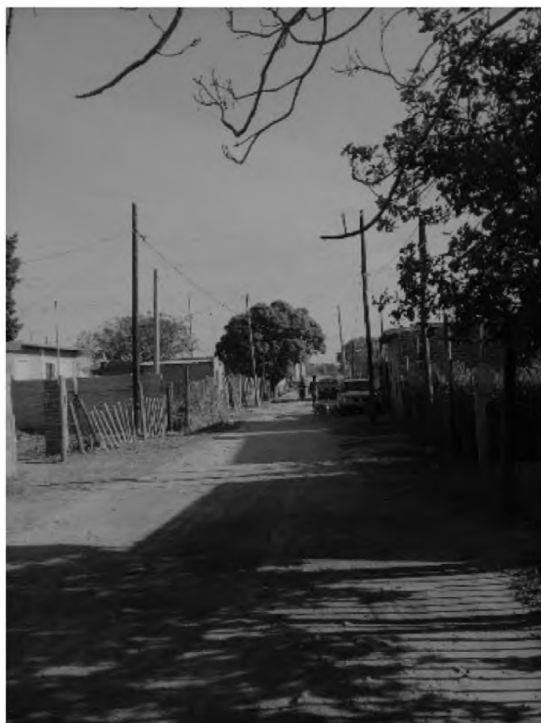
Figura 7. Imagen del asentamiento Combate de Obligado. Foto propia, 2021