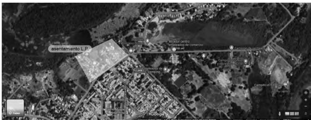
Figura 4. Localización del asentamiento LP.

Pero, qué loco, digo yo, qué ilógico (...) fijate que allá atrás, que es un asentamiento nuevo, mucho más nuevo que el de acá, están haciendo viviendas y están en la misma situación que nosotros, y están cerca también de la laguna, y a ellos sí le aprobaron para hacer viviendas, y nosotros, que queremos, porque todavía queremos regularizar, pagar nuestro terreno, nuestra luz, nuestra agua, no nos dan la oportunidad de hacer eso (...) porque el APA no nos autorizaba (entrevistada 2).