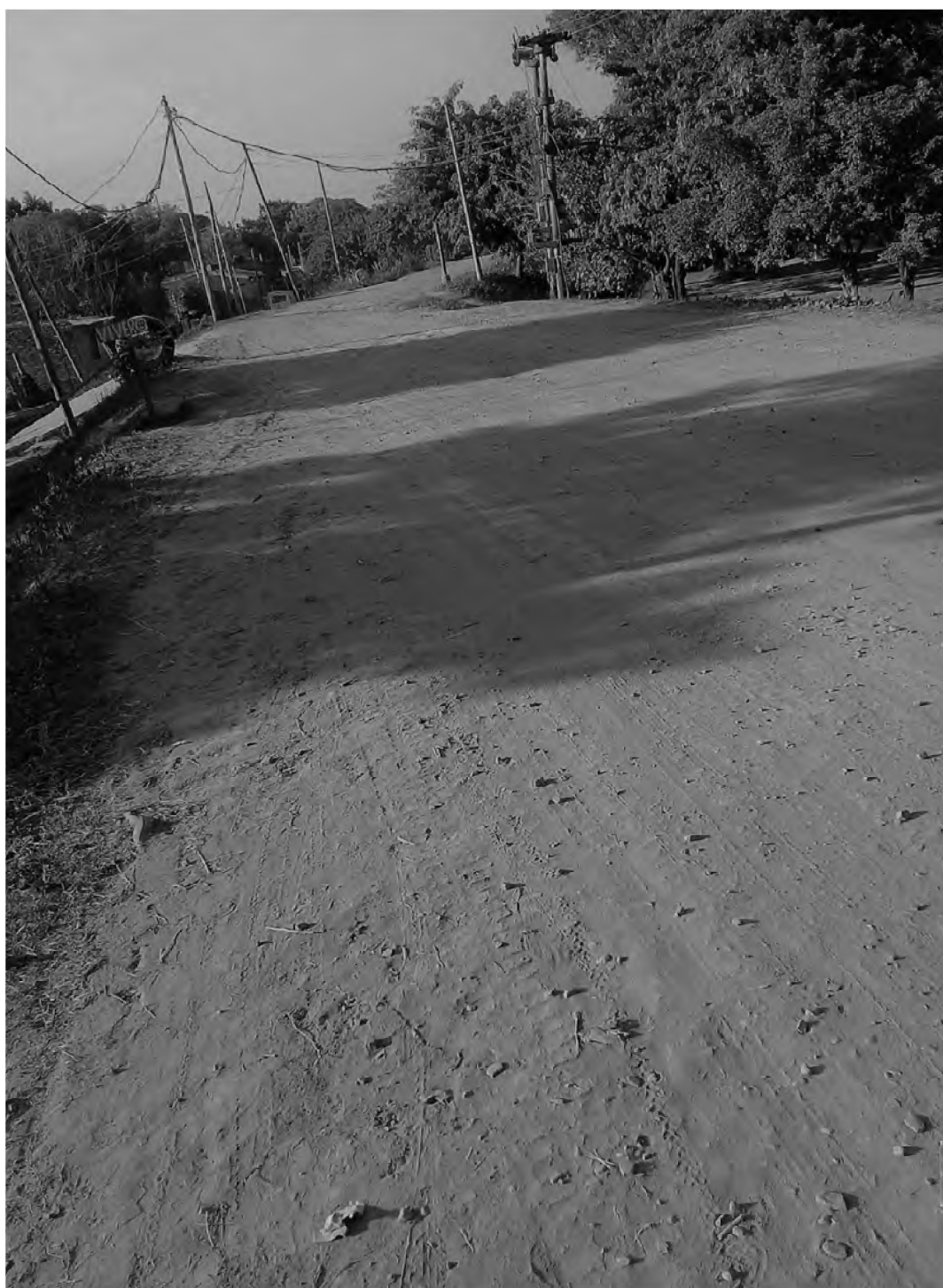
Figura 5. Foto del entorno del asentamiento Las Piedritas.

completas y terminadas y cerradas y otras más precarias.