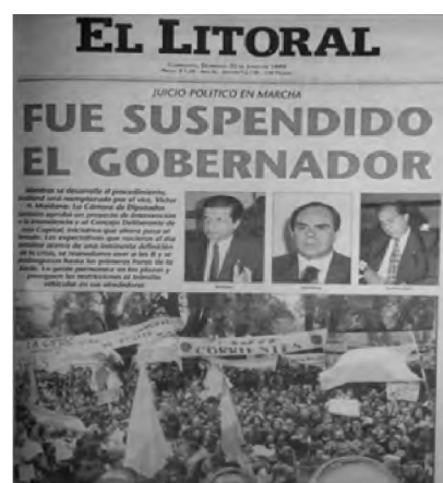
Figura 15. Tapa del diario El Litoral. 20-06-1999.