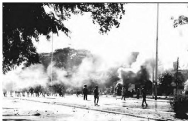
Figura 19. Enfrentamiento en el puente Gral. Belgrano. Año 1999. Fuente: https://www.ellitoral.com.ar/corrientes

Fuente: https://www.ellitoral.com.ar/corrientes