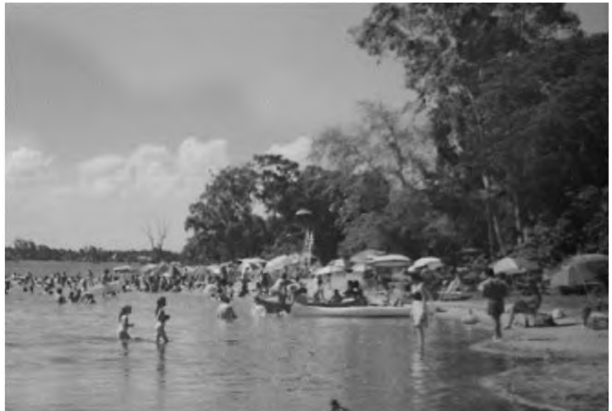
Figura 12. Foto playa Buganvilla. Año 1995.

la Av. costanera al borde del río Paraná y a continuación de la Av. Costanera Gral. San Martín. La obra fue proyectada como defensa costera, obra vial y de generación de 900 ml de playa sobre el río. Esta situación competía con las ofertas de la laguna y aceleró el cambio que ya estaba en movimiento: la reconversión de las playas de la laguna Soto a clubes de campo.