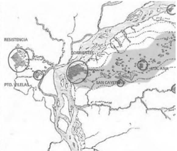
Figura 9. Áreas de lagunas, arroyos y bañados. Figura 10. Áreas de lagunas y bañados, noroeste de la provincia de Corrientes

En el área gris, se pueden observar las lagunas y riachos que están incluidos en los humedales. La ruta nacional N.º 12 los fragmenta, pero al mismo tiempo permite su accesibilidad, oportunidad aprovechada por los municipios del interior para ofertas recreativas y turísticas.