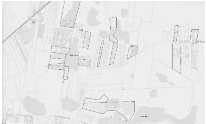
Figura 6. Mapa Gis con sectorización de Clubes de Campo (CC)

la normativa que subraya las zonas con interés paisajístico . Pareciera, de esta manera, que el interés en el paisaje solo es para los dueños que la rodean.