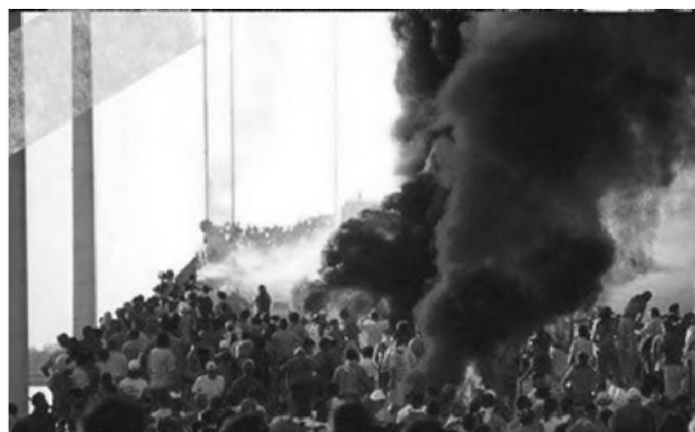
Figura 18. Enfrentamiento en el puente Gral. Belgrano. Año 1999.