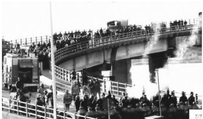
Figura 17. Toma del puente Gral. Belgrano. Año 1999.