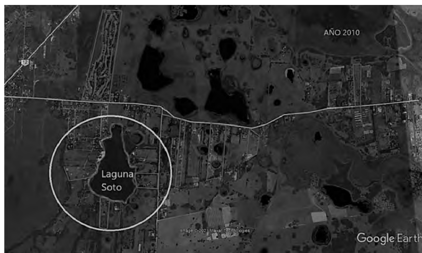
Figura 4. Sectorización de los desarrollos inmobiliarios, sobre laguna Soto. Año 2010

encuentran en áreas no habilitadas (los distritos ZPA 7 -AR 8 ), pero a través del pedido excepción en el Concejo Deliberante lo pudieron lograr. Estas estrategias posibilitan la oferta inmobiliaria que más se ha extendido y operado con un inductor de la ocupación en territorios con lagunas y humedales.