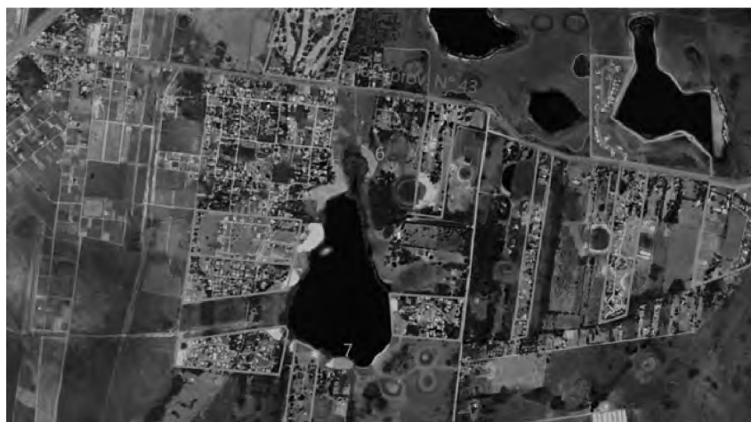
Figura 14. Clubes de campo y playas en laguna Soto, en la actualidad

parte del municipio de la Ciudad de Corrientes el 19 de noviembre de 2009 ( Ordenanza N.º 5202 ). El municipio no participó del beneficio que les otorgó a los dueños de lotes afectados por la ordenanza.