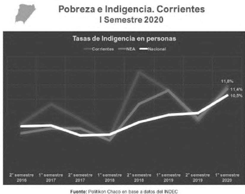
Figura 1. Pobreza e indigencia en Corrientes

La ciudad de Corrientes y la de Resistencia (Chaco) conforman un conglomerado de, aproximadamente, 1.000.000 de habitantes. Ambas (y de forma rotativa) se alternan los puestos con índices más altos de pobreza de la región. A su vez, la región NEA, según datos oficiales del INDEC, es la más pobre de la Argentina: casi el 43 % de los ciudadanos no alcanzan a cubrir la canasta básica y un 11 % vive en la indigencia.