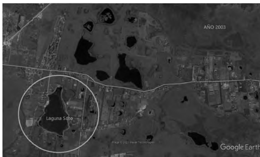
Figura 3. Sectorización de los desarrollos inmobiliarios sobre laguna Soto. Año 2003