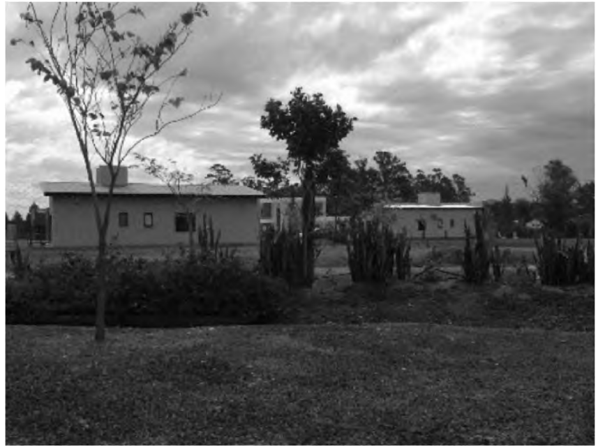
Figura 21. Foto viviendas Club de Campo Santa Teresita. Año: 2021.

En este caso, los dueños empresarios de la construcción venden el suelo y o la casa: con el mismo prototipo (cual vivienda Fonavi), duplicando con esta estrategia sus ganancias.