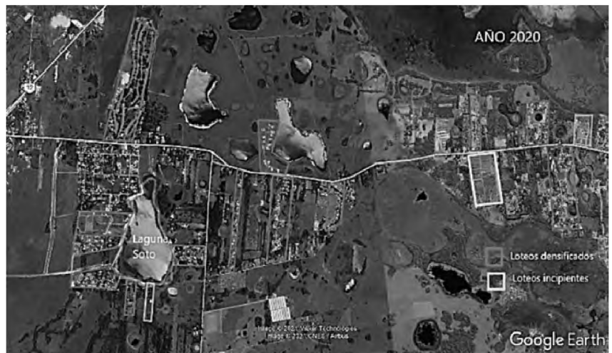
Figura 5. Sectorización de los desarrollos inmobiliarios sobre laguna Soto. Año 2020