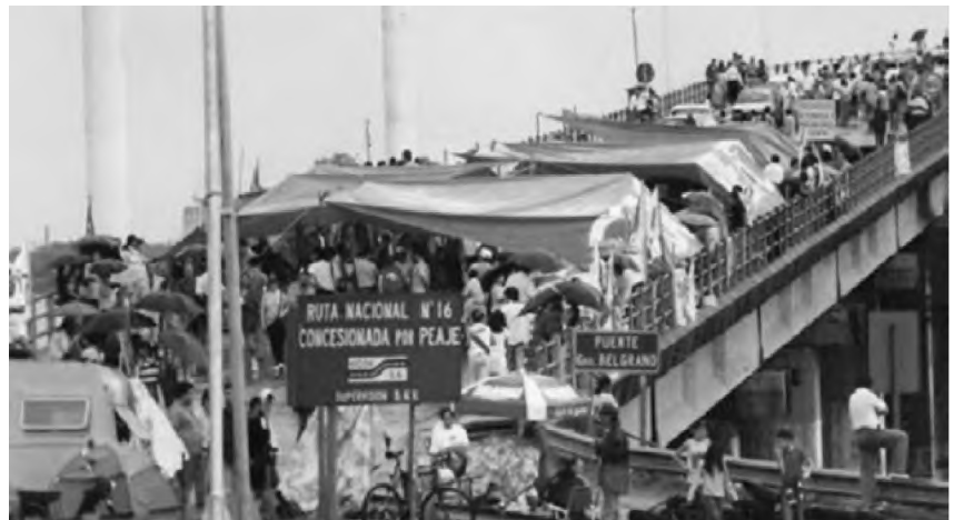
Figura 16. Toma del puente Gral. Belgrano. Año 1999.

Pocas las veces, en la historia de Corrientes, existieron ocasiones de sublevación y de enfrentamiento del pueblo correntino, sobre un orden establecido. Esta fue una de ellas, en donde parte de la población se sublevó y estableció una nueva forma organizativa: los “autoconvocados”.