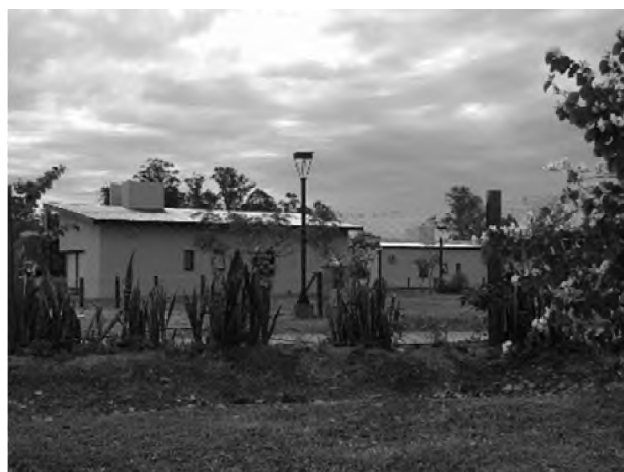
Figura 20. Foto viviendas Club de Campo Santa Teresita. Año: 2021.