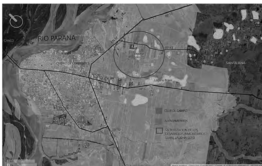
Figura 2. Mapa de Corrientes: asentamientos, clubes de campo y lagunas.