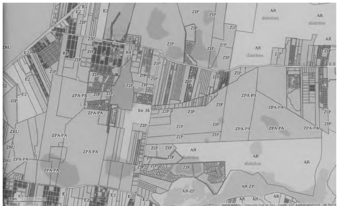
Figura 7. Mapa Gis con sectorización de clubes de campo y distritos