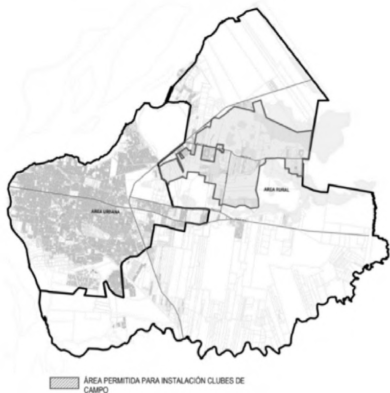
Figura 8. Área para Clubes de Campo.