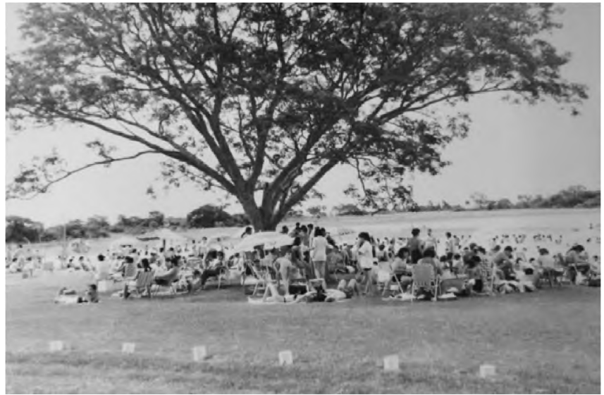
Figura 11. Foto playa Costa Paraíso. Año 1998.