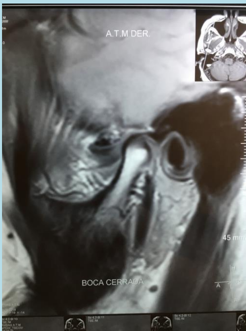
Figura 1. Corte sagital ATM derecha

En el corte coronal de la ATM derecha se observa que tiene un diámetro 16.1 lo que nos determina una disminución marcada en sus diámetros productos de los procesos degenerativos, siendo 19 mm normal. En Figura 2 se puede observar las diferencias marcadas entre ambos cóndilos.