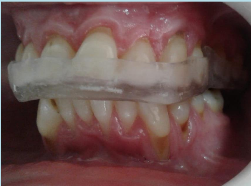
Figura 4. Placa Orgánica instalada en Boca

Al paciente se la controló a los 15, 30 y 60 días donde los cambios fueron mejorando en forma gradual, en el segundo control (30 días) el paciente relató no tener sintomatología dolorosa, y los ruidos no habían desaparecido del todo, pero disminuyeron en forma significativa ya que la paciente los determinaba como tolerables o imperceptibles.