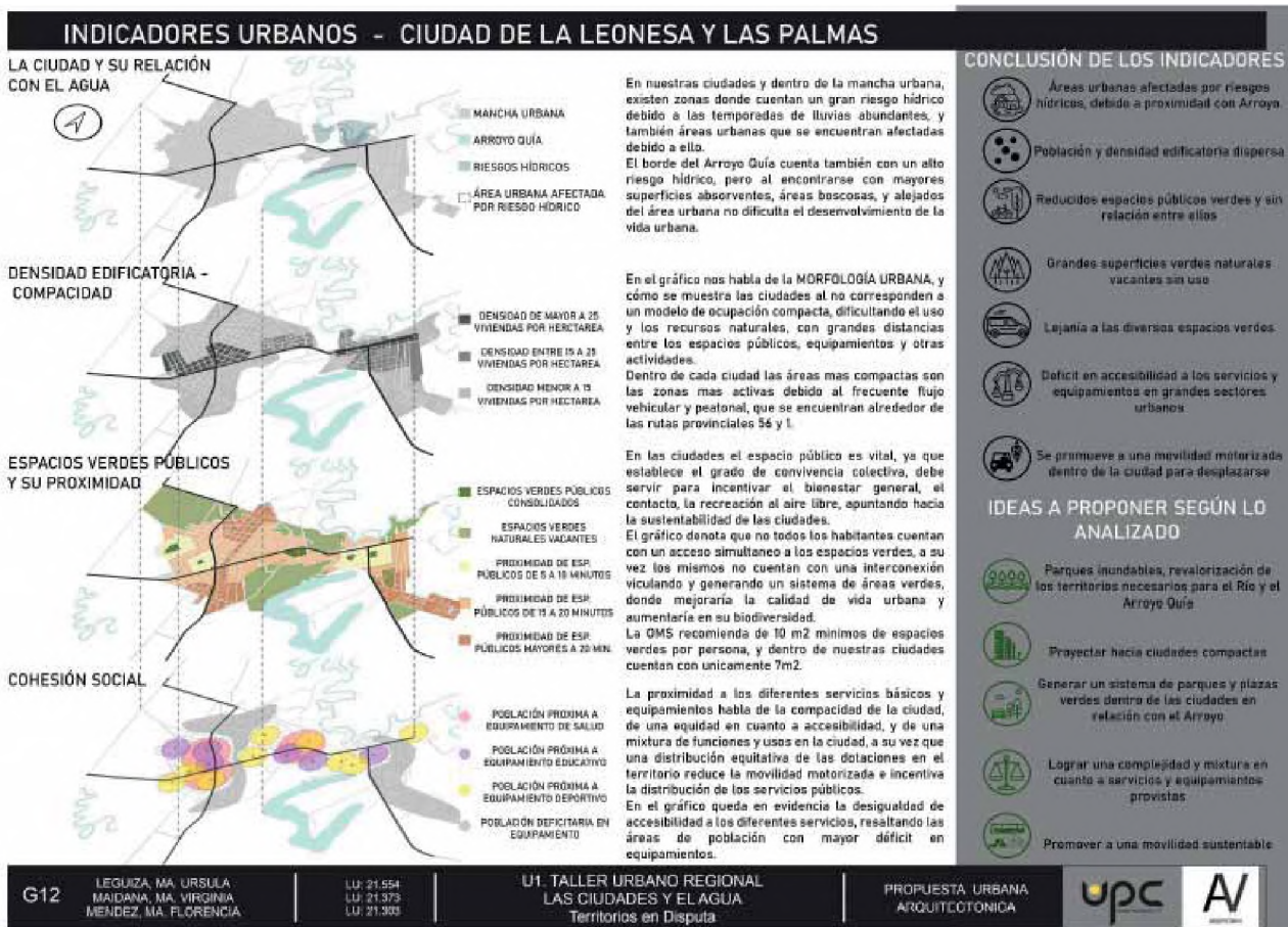
Figura 1. Indicadores urbanos ciudades de La Leonesa y Las Palmas. Taller Urbano Regional 2020.

de personas —y no de vehículos—, para incentivar la interacción, el contacto y el bienestar. Como tercer grupo aparecen los (3) indicadores relacionados con la complejidad. Las ciudades deben entenderse en su complejidad, es decir, el grado de organización urbana de un territorio es una de las claves para mejorar la eficiencia de los sistemas urbanos en él. La mezcla de funciones y usos urbanos en un mismo espacio urbano residencial. Se propicia la diversidad