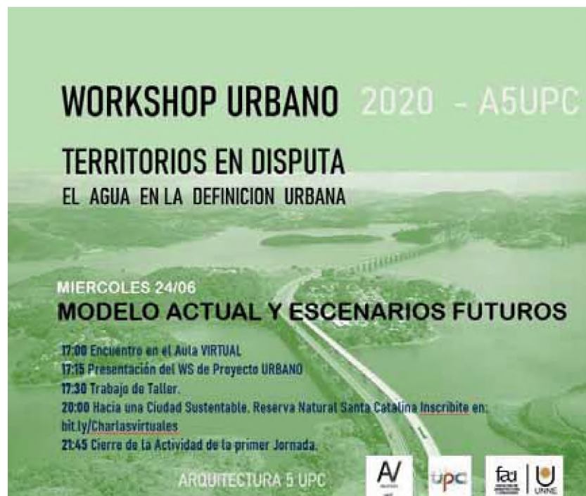
Figura 3. Taller Urbano Regional 2020.

busca generar conocimientos específicos sobre el proyecto territorial urbano como ámbito disciplinar de la arquitectura, con herramientas metodológicas de diseño que articulen teoría y práctica, investigación y procesos proyectuales que desplieguen visiones y soluciones integrales promoviendo un aprendizaje de los instrumentos metodológicos que ayuden en el proceso de toma de decisiones proyectuales para una adecuada relación hombre-naturaleza. Si bien se trata de líneas de trabajo en desarrollo, la propuesta preliminar busca encontrar espacios urbanos potenciales que puedan definirse como áreas de oportunidad proyectual en variables de densidad, flujos, condiciones de