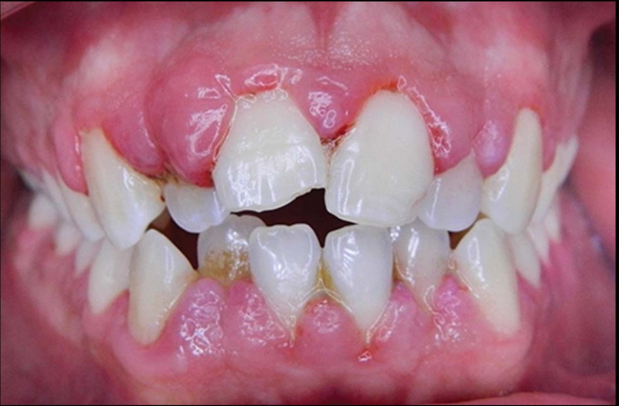
Imagen pre operatoria.