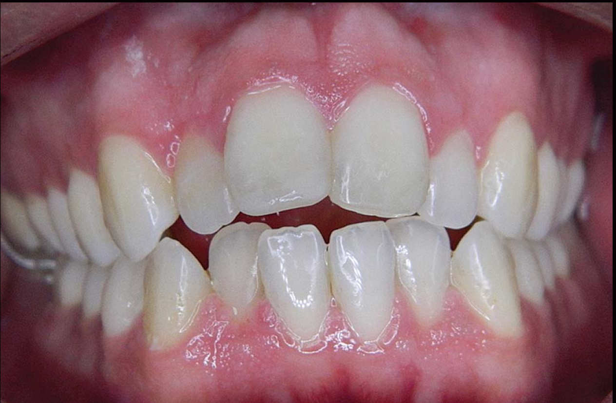
Control a los 3 años con excelente nivel de higiene.