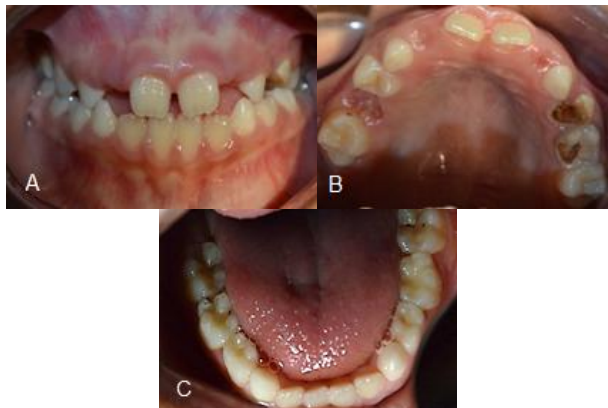
Figura 1. Fotografías intraorales pretratamiento.