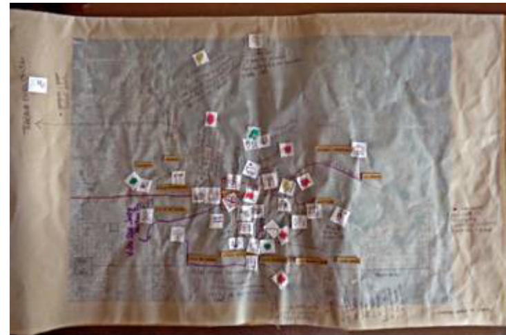
Imagen 8. Mapa B - "Lo que sucede fuera del barrio"

El trabajo consistió en caracterizar y expresar la valoración de la relación con los barrios del entorno, a partir de marcar los motivos de vinculación con cada uno, los recorridos frecuentes, la modalidad y medios. Algunas preguntas disparadoras contenidas en la consigna consistieron en: ¿Tienen amigos /familiares en otros barrios? ¿Dónde? ¿Dónde estudian/trabajan/realizan compras? ¿Cuál es el circuito que se recorre para llegar? ¿Hay sectores conflictivos en los barrios? ¿Por qué? ¿Qué colectivos pasan? ¿Cómo se llega a los otros barrios? ¿Qué actividades realizan en otros barrios? ¿Cómo nos relacionamos con los demás vecinos? ¿Tienen problemas en algunos lugares y horarios? ¿Dónde? ¿Por qué?