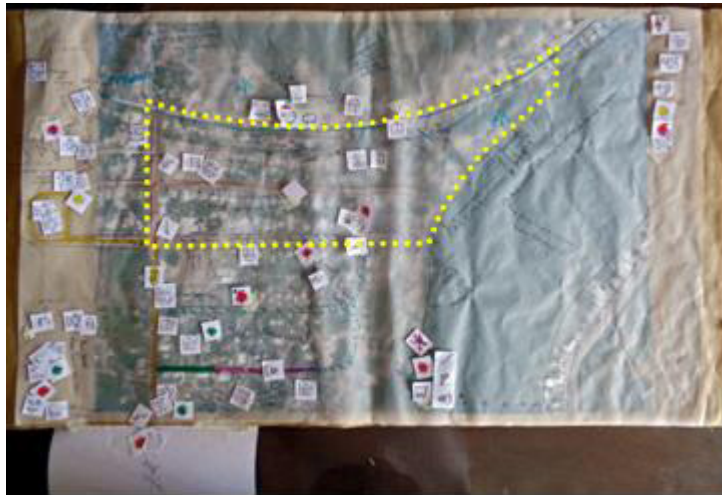
Imagen 7. Mapa A - "Lo que sucede dentro del barrio"

Algunas preguntas orientadoras contenidas en la consigna consistieron en: ¿Cómo veo a mi barrio? ¿Cómo lo ubico? ¿Cómo siento que nos ven los demás barrios? ¿Cómo nos llevamos entre vecinos? ¿Qué actividades realizamos? ¿Dónde? A partir del diálogo y la elaboración progresiva del mapa, se realizaron preguntas específicas para profundizar en otros aspectos, como la inseguridad, las diferencias sociales, etc.