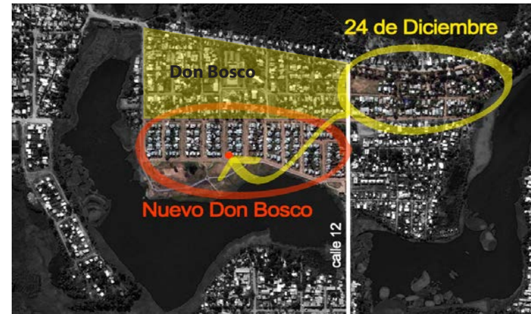
Imagen 9. Localización del asentamiento 24 de Diciembre, Bº Don Bosco y Bº Nuevo Don Bosco