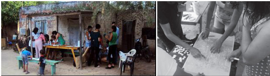
Imágenes 3 y 4. Mapeo Colectivo en el Asentamiento 24 de Diciembre

Para ello, se prepararon previamente cartografías de base, guías de trabajo de campo, elementos de dibujo e iconografía. Además, se acordaron los roles a desempeñar en la aplicación del Mapeo Colectivo.