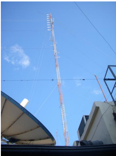
Fotografía N° 1: Lugar donde se efectuó la evaluación de niveles cercano a una antena transmisora de frecuencia modulada.

En las mediciones realizadas se presentaron dificultades asociadas a la configuración edilicia del lugar. Los niveles evaluados con la sonda variaban según los sitios donde se realizaron las medidas, debido a la topología compleja del entorno cercano, el material de las construcciones que actúan de superficies reflectoras y la orientación relativa de las mismas, la línea de vista de las antenas, factores que actúan reforzando o debilitando el campo electromagnético medido.