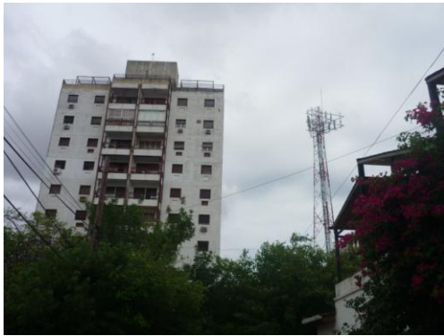
Fotografía N° 2: Edificio donde se realizó la evaluación de niveles de RNI.

Las mediciones realizadas en los edificios de propiedad horizontal, dentro de las dependencias del mismo, evidenciaron el fuerte rol que desempeña el material utilizado en la construcción, determinando valores de atenuación mayores para aquellas paredes de hormigón armado con mucho hierro en su armadura y valores sustancialmente menores para aquellas de ladrillo hueco. En la zona de terraza de ambos edificios se pudo comprobar un nivel elevado de los valores de densidad de potencia medidos. Las superficies reflectante metálicas tales como parasoles y membranas de aluminio actúan reforzando los valores en determinadas zonas aumentando de forma considerable los valores medidos.