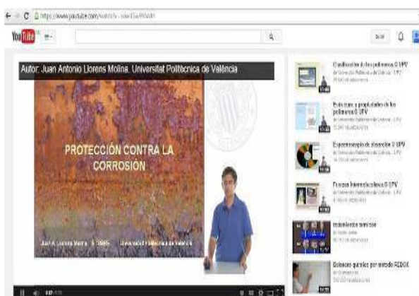
Figura 2. Pantalla de inicio del video sobre corrosión

El material de estudio estuvo disponible en el bloque Textos de Cátedra y en el bloque Sitios Recomendados se habilitó un link al videopublicado en el sitio conocido como YouTube el que se muestra en la Figura 2.