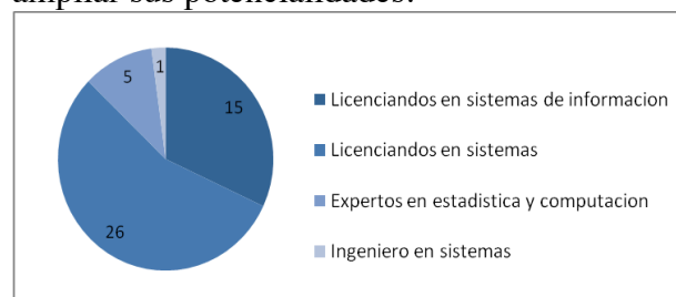
Fig. 2. Alumnados del PUI según la titulación obtenida, en etapa de finalización.

El PUI se inicia en 2013 con número de 56 inscriptos, actualmente se encuentran en la etapa de finalización, un total de 47 profesionales ( Fig. 2 ). En relación a ello, se resalta la conciencia y compromiso puestos en este Ciclo, lo que supone estar dispuesto a invertir tiempo y esfuerzo; favoreciendo ampliar sus potencialidades.