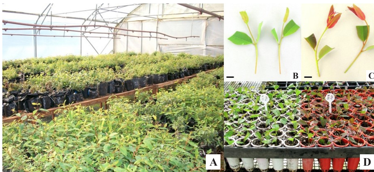
Figura 1. Vista de minijardín clonal de plantas madres dadoras de miniestacas (A). Estacas listas para la inducción del enraizamiento GC-INTA-9 (B) y GC-INTA-12 (C). Miniestacas sembradas en tubetes individuales y acondicionadas en invernáculo (D). Escala de barra = 1 cm.