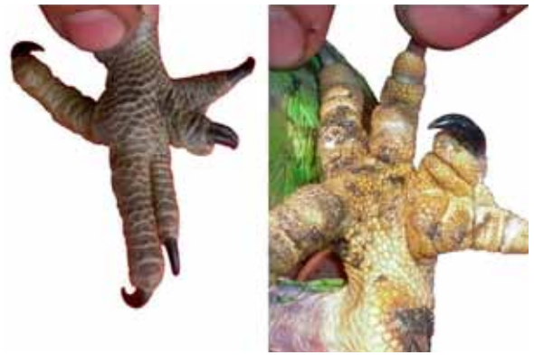
Figura 1. Vista dorsal y plantar del miembro pelviano derecho del pichón de “loro hablador” ( Amazona aestiva ) con polidactilia.

En cambio, las plumas del ala derecha mostraron una alteración en el patrón de coloración tanto para las barbas externas como internas. Las barbas externas mostraron rojo en la base de la pluma (en lugar de amarillo), luego amarillo (en lugar de verde), verde y por úl-