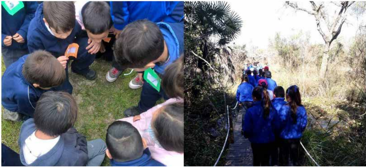
Figura 3: Visita guiada y actividades de aplicación en senderos de interpretación ambiental del Parque Provincial San Cayetano (San Cayetano, Corrientes)

leza. Estos ambientes fueron el bosque inundable, palmares de caranday, pajonales de paja colorada, e isletas de bosques en zonas altas. Para cada ambiente los guías implementaron nuevas actividades lúdicas que describían la composición florística y la fauna característica. En este tipo de actividades se incluyen cuentos, mitos y leyendas sobre el hombre y su relación con la naturaleza lo que otorga gran valor cultural (Fig. 3).