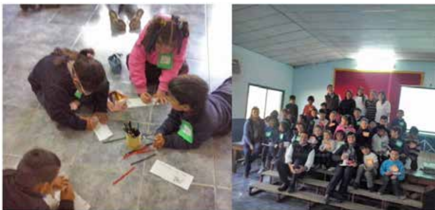
Figura 1: Charla-taller con estudiantes de primer grado de la Escuela N° 553 San Cayetano.

Las actividades tuvieron dos etapas un trabajo de charla-taller en el patio de la escuela y otra etapa de una salida guiada en el Parque Provincial San Cayetano (San Cayetano, Corrientes). La charla-taller se realizó el 7 de junio de 2018, en el cual participaron 25 estudiantes de entre 6 a 7 años separados en pequeños grupos de 4 a cinco integrantes y tenían como guía a un integrante del equipo de trabajo y una maestra/o (Fig. 1).