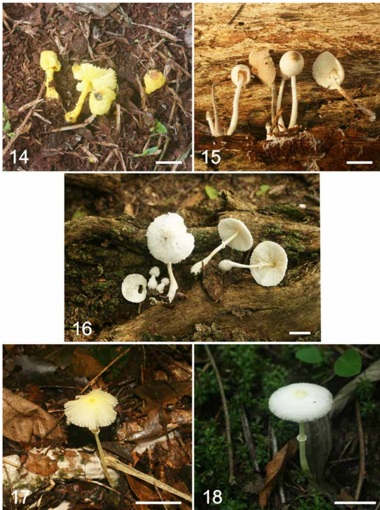
Figs. 14-18. Caracteres macroscópicos. 14. L. birnbaumii ; 15. L. cepistipes ; 16. L. cretaceus ; 17. L. fragilissimus ; 18. L. straminellus . Escala = 20 mm.