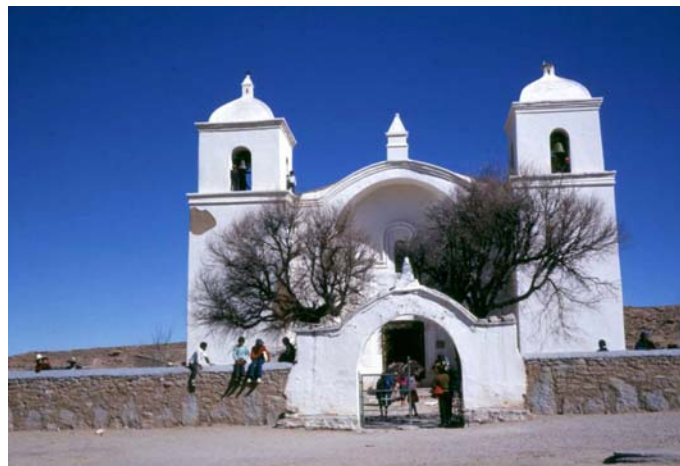
Imagen 8. Iglesia de Casabindo. 1972.

c) El indígena es un artífice del espacio artístico-cultural colonial. La articulación entre historia, naturaleza, arte y gente es una constante en el corpus . Por ello la cámara focaliza las iglesias coloniales y el patrimonio artístico de las mismas, donde la pertenencia a ese mundo colonial no está negada, sino valorada desde la presencia indígena. También las festividades y rituales donde él advierte la síntesis de la cultura ancestral con elementos hispano-coloniales, y que integrarían parte del patrimonio intangible de su pueblo. Ello también lo expresa al afirmar: “Existió un sincretismo artístico en los Andes, que se puede observar todavía en las iglesias de la Quebrada y la Puna jujeñas.” (Vázquez, 1995:18), o cuando expresa que la fiesta es “... un punto de encuentro de culturas... entre las fiestas no institucionalizadas, que se transmiten de padres a hijos, se puede distinguir entre las que vienen de la religión antigua y las cristianas... El carnaval es una mezcla del carnaval traído por los conquistadores con las fiestas de la cosecha del maíz que efectuaban los indígenas...” (Vázquez, 2001:14).