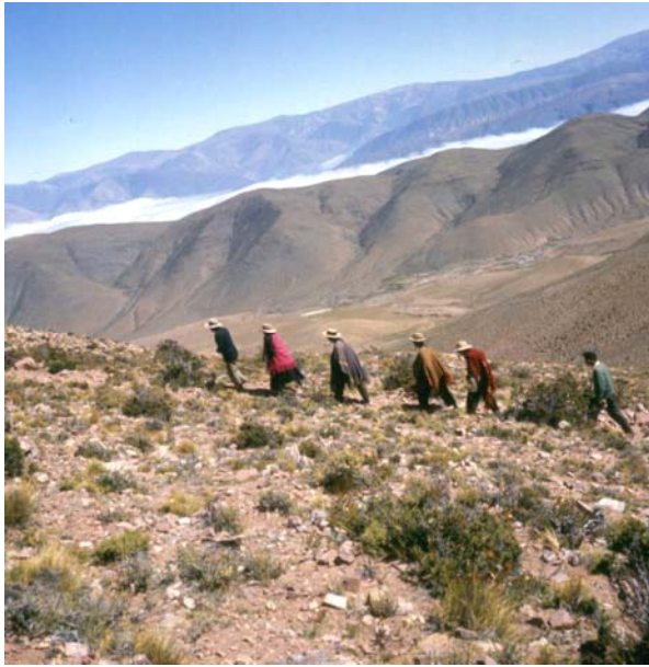
Imagen 7. Promesantes en abra donde apareció la Virgen de Punta Corral. Punta Corral, 1980.

c) El indígena es un artífice del espacio artístico-cultural colonial. La articulación entre historia, naturaleza, arte y gente es una constante en el corpus . Por ello la cámara focaliza las iglesias coloniales y el patrimonio artístico de las mismas, donde la pertenencia a ese mundo colonial no está negada, sino valorada desde la presencia indígena. También las festividades y rituales donde él advierte la síntesis de la cultura ancestral con elementos hispano-coloniales, y que integrarían parte del patrimonio intangible de su pueblo. Ello también lo expresa al afirmar: “Existió un sincretismo artístico en los Andes, que se puede observar todavía en las iglesias de la Quebrada y la Puna jujeñas.” (Vázquez, 1995:18), o cuando expresa que la fiesta es “... un punto de encuentro de culturas... entre las fiestas no institucionalizadas, que se transmiten de padres a hijos, se puede distinguir entre las que vienen de la religión antigua y las cristianas... El carnaval es una mezcla del carnaval traído por los conquistadores con las fiestas de la cosecha del maíz que efectuaban los indígenas...” (Vázquez, 2001:14).