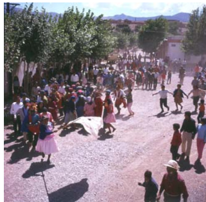
Imagen 5. Comparsa Los Picaflores bailando carnavalito. Humahuaca. 1970.