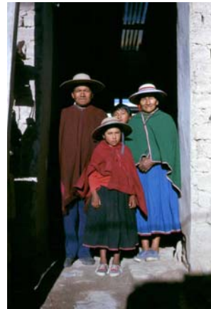
Imagen 2: Familia vallista, Humahuaca 1983.

Si apreciamos en su conjunto estas miles de imágenes diríamos que Zuleta hizo un inventario visual de las realidades socio-culturales de su grupo de pertenencia, o aún más, pretendía construir visualmente su propio sentido de pertenencia, su propio “ser qolla ”. Es en este punto donde se evidencian los conceptos de Mitchell que mencionábamos inicialmente y en los que se sustenta este artículo: las relaciones específicas de la visión con las prácticas culturales particulares.