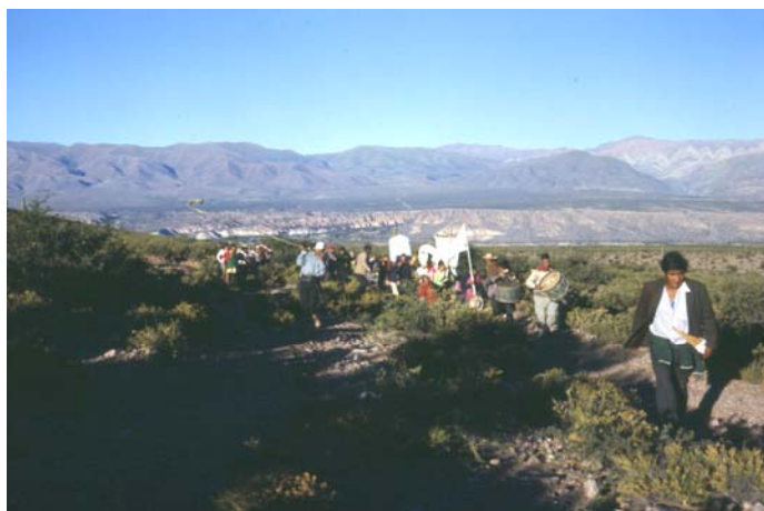
Imagen 9. Peregrinación a Cuchiyaco en las afueras de Humahuaca. 1974.