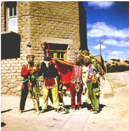
Imagen 4. Domingo de Tentación. Disfrazados con sartas para la Pachamama. Humahuaca. 1976.

Zuleta asume que en la cultura indígena se puede ser indio aún viviendo en la ciudad, en el mundo moderno, pero conservando la lengua, haciendo sus ritos a la Pachamama, viviendo en armonía con la naturaleza y compartiendo los problemas de los indígenas (Vázquez , 1995:153), considera que “ en la sociedad de consumo, los indios, con nuestra cultura tradicional, no tenemos cabida, pues en ella se suprime nuestro proceso vital armónico... ” (Op. Cit: 155). Por ello rescata la cultura tradicional desde la visualidad como modo de contrarrestar los “ cambios vertiginosos ” que mencionaba anteriormente.