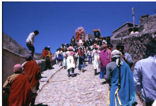
Imagen 3. Fiesta patronal de Iruya, 1971.

Si apreciamos en su conjunto estas miles de imágenes diríamos que Zuleta hizo un inventario visual de las realidades socio-culturales de su grupo de pertenencia, o aún más, pretendía construir visualmente su propio sentido de pertenencia, su propio “ser qolla ”. Es en este punto donde se evidencian los conceptos de Mitchell que mencionábamos inicialmente y en los que se sustenta este artículo: las relaciones específicas de la visión con las prácticas culturales particulares.