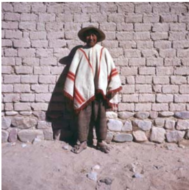
Imagen 1. Quebradeño con atuendo de diario. Rodero. 1966.

naturales, vistas de poblaciones, fiestas religiosas y populares y patrimonio artístico y arquitectónico. A ello se suma un registro de escenas étnicas, restos arqueológicos, escuelas rurales, producción artesanal, trabajo rural, flora y fauna, etc. Es verdad que todo ello, en su conjunto, es difícil encontrarlo en la producción de un mismo fotógrafo en una extensión temporal que abarca tres décadas, pero la cuestión central en esta producción es dónde se ubica Zuleta para obturar la cámara. “ Yo soy uno más de ellos, yo participaba de todo lo que aparece en las fotos. Estaba ahí para participar ” expresa el propio Toqo, y esto explica los retratos en el interior de una casa, en una iglesia, las procesiones rituales en medio de la montaña, las ferias y la producción artesanal, las comidas o las materialidades que constituyen el contexto cotidiano del mundo qolla y que señalan en parte un territorio interior aunque obtenido por una técnica del exterior de este mundo, propia del mundo hegemónico.