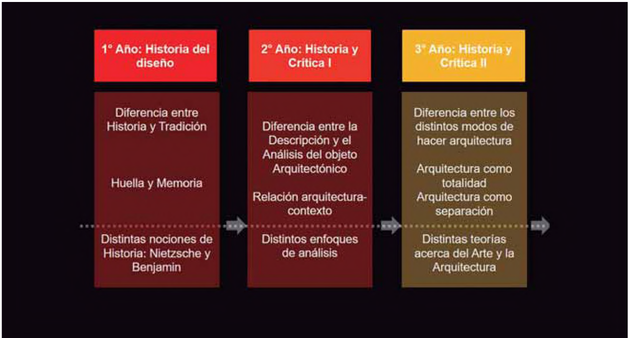
Figuras 1 y 2. Placas utilizadas en el II Seminario para explicar y poner a consideración una posible estructura ajustada a contenidos y competencias de complejidad creciente.