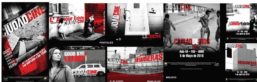
Imagen gráfica del Ciclo Ciudad Cine.

Autores: Federico Zurko, Nicolás Caracho, Luis Sánchez, Facundo Santa Cruz.