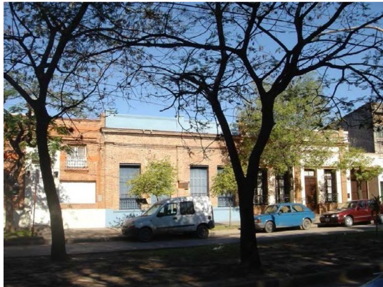
El entorno de la plaza sobre avenida San Martín

La cuadra que corresponde a la calle Colón contiene algunas casas de familia de una sola planta, con diseños que corresponden al chalé de principios de siglo y un gran sector que está ocupado por la fachada de la iglesia San Javier y sus dependencias aledañas.