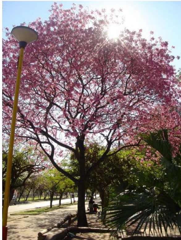
La plaza España en primavera y vereda sobre Av. Rodríguez Peña

El último sector es el triángulo cuya base se extiende paralela a la avenida Rodríguez Peña. Incluye la presencia de la vía del tren Sefecha. Este es el único sector totalmente verde, con árboles y césped, sin ningún equipamiento, y que es utilizado en verano para hacer ejercicios físicos. Abundan los lapachos tanto dentro de la plaza como en su entorno, los que florecen en primavera y presentan un paisaje de colores inolvidables.