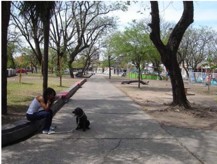
Plaza España. Día de semana de mañana