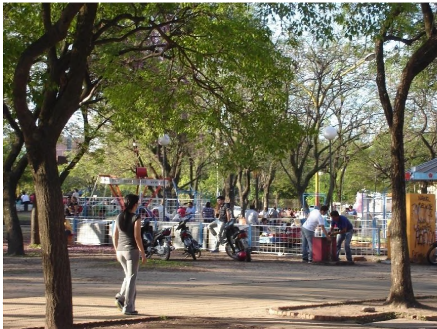
Plaza España. Zona de la calesita, día domingo

Los grupos de batucada se instalan en el sector de césped que se encuentra sobre la Av. Rodríguez Peña. Este sector es muy utilizado en los meses de verano por los grupos que realizan gimnasia de noche.