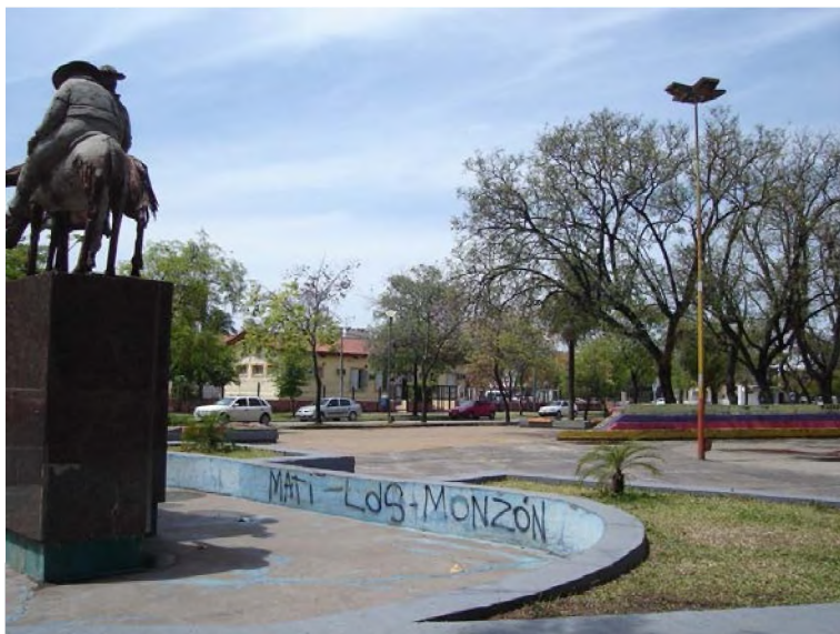
Plaza España. Día de semana, medio día