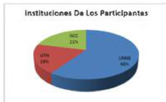
Figura 1. Instituciones de los participantes (UNNE: Univ. Nacional del Nordeste, UTN: Univ. Tecnológica Nacional; ISCC: Instituto Superior Curuzú Cuatía).

La muestra utilizada quedó integrada por 385 alumnos distribuidos como se indica en la Figura 1.