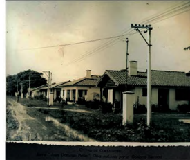
Planimetría e imagen del barrio Perón en el momento de su habilitación

“En esta felicidad emblemática en una imagen asociada con la vida privada —‘vivir como la gente’—, pero construida y promovida en términos públicos, la obra pública ocupaba un lugar destacado y, en particular, los conjuntos de vivienda masiva, representados en la obra por chalecitos californianos, operaban como símbolos de la adquisición de nuevos derechos y de la extensión del bienestar, es decir, de una transformación completa del mundo popular” (BALLENT, 2005: 20). Desde lo tipológico, las viviendas denotaron la adscripción al modelo de “casa cajón”, en virtud de plantear una solución funcional compacta e introvertida, eliminando la presencia de circulaciones externas, localizando en algunos casos referencias a la galería en las fachadas y semiperímetro, pero actuando como espacio intermedio de expansión antes que como conector de espacios interiores. Se dan asimismo ocho tipologías, de las cuales seis corresponden a dos dormitorios y dos a tres dormitorios, con variantes en la distribución de espacios interiores. A modo de ejemplo, se toman como caso una tipología de dos y otra de tres dormitorios.