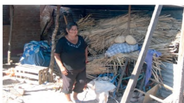
Imagen 1. Depósito improvisado de materia prima para artesanía en una vivienda social del Barrio Chellyi de Resistencia.

que permitirán abordar, en una próxima instancia, el estudio de un caso de una área urbana deficitaria crítica (AUDC) (BARRETO, 2010) del Área Metropolitana del Gran Resistencia (AMGR). Algunos de los supuestos presentes en la base de este estudio sostienen que incluso cuando los destinatarios son beneficiados con alguna solución habitacional del Estado, las viviendas nuevas de los hogares de bajos recursos no contemplan las necesidades de albergar las actividades de subsistencia de las que viven los habitantes de estos hogares, por lo que, a su vez, aquella termina también afectando sobremanera su calidad de vida.