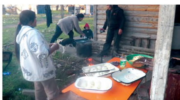
Imagen 2. Preparación y cocción de alimentos para venta de productos locales en vivienda social del Barrio Toba de Resistencia. 2