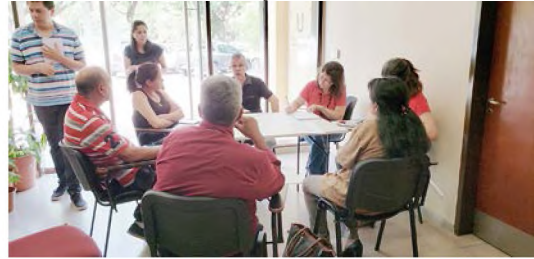
Imágenes 1 y 2. Momentos de debate en el Foro Multiactoral en el Salón Popolizio del CES UNNE. Octubre de 2018