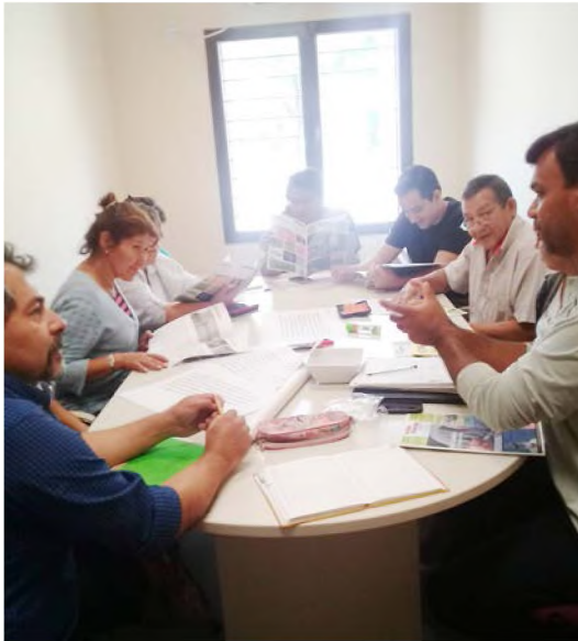
Imágenes 3 y 4. Momentos de debate del Foro Multiactoral en el Salón Popolizio del CES UNNE. Octubre de 2018