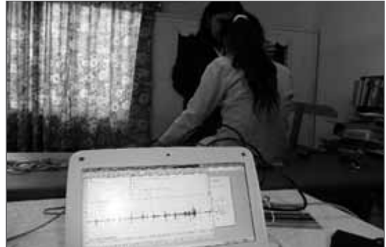
Figura 8. Carga de datos

médicas, el uso de la TIC (videoconferencias, tele-consultas e interconsultas) y la incorporación de equipos de telemetría de parámetros médicos y colaborar en el desarrollo de programas de seguimiento, control y promoción de la salud de los involucrados.