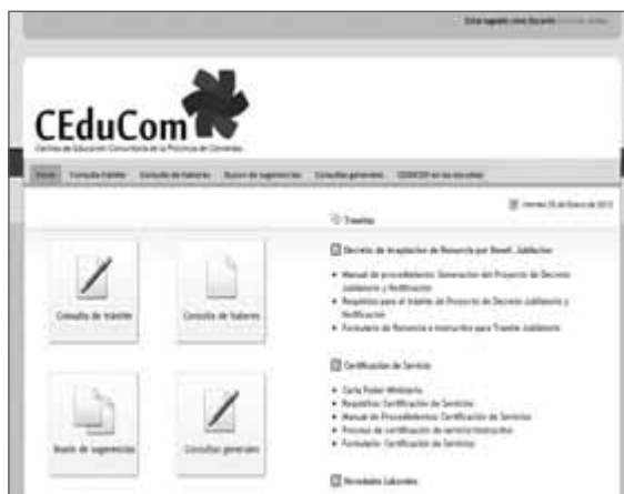
Figura 5. Portal de consulta de trámites administrativos para docentes

Para lograr mejores resultados en cuanto a la digitalización de los datos y su confidencialidad se propone desarrollar una plataforma a éste efecto, través de un portal de servicio denominado ceducom.net . Con el