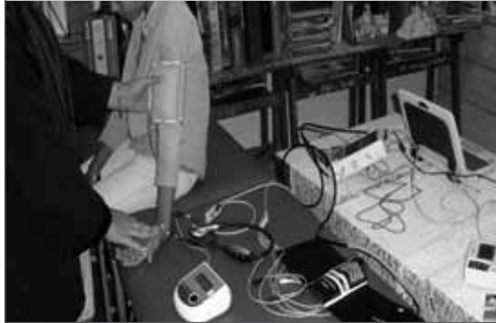
Figura 7. Captura de datos

población, consideramos imprescindible la generación de un área de Telemedicina Rural para los trabajadores docentes, pudiéndose extender el servicio a sus alumnos y familiares que radiquen en la zona del establecimiento. Idealmente, el sistema debe comprender el almacenamiento digital de fichas