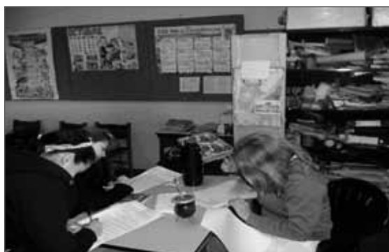
Figura 3: Entrevista a docentes rurales