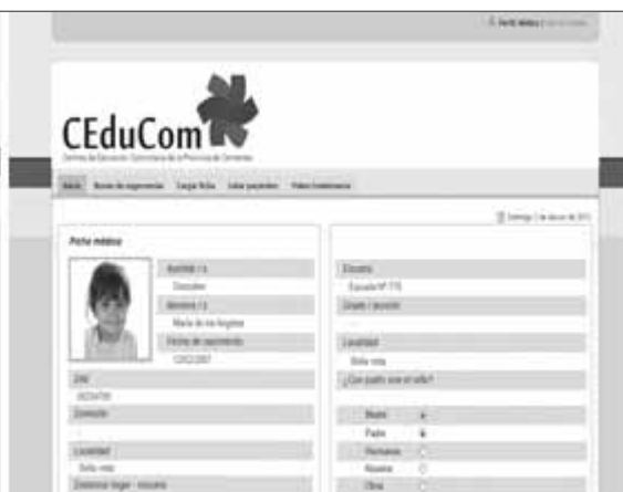
Figura 6. Ficha sanitaria digital (programa ceducom.net)

servicio, reclamos de conceptos de su salario, etc. Asimismo, que las autoridades del