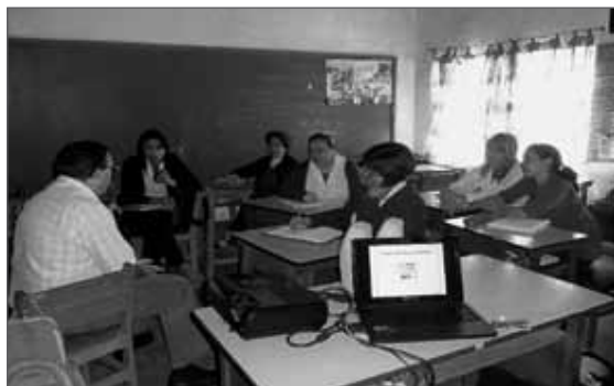
Figura 1: Taller a docentes

En cuanto a la organización y el contenido de trabajo, estos factores están determinados directamente por el tipo de proceso de trabajo que predomine en la empresa y particularmente en el puesto de trabajo.