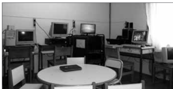
Figura 2. Relevamiento de equipos informáticos existentes en escuelas

Para la implementación del instrumento antes nombrado, se realizó una guía de preguntas semi-estructuradas a modo de orientación, la cual, debía ser completada en el mismo lugar de trabajo, durante la entrevista, y, además, permitió a los docentes entrevistados explayarse sobre un concepto propio del tema a tratar “la satisfacción laboral”, con el objetivo de analizar todas las variables planteadas.