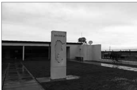
Figura 4. Visita a establecimientos educativos rurales

ello depende el futuro de los niños en condiciones socio-económicas más vulnerables; están de acuerdo con las jornadas, licencias de trabajo y periodos de descanso, con las evaluaciones de desempeño que reciben y la comunicación que existe entre sus pares y superiores (directores, supervisores).