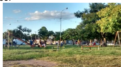
Fig 3, 4 y 5. Plaza del Ejercito Argentino . 03/2015