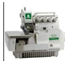
Máquina de coser Overlock

“Hacía pañuelos para uniformes para las escuelas que era a dónde tenía acceso para entrar.” Le encantaría poder seguir haciendo eso pero sus