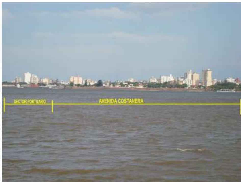
Imagen de la ribera correntina desde la costa chaqueña. El perfil urbano denota un paisaje arquitectónico heterogéneo, caracterizado por la existencia de numerosos edificios en altura en el sector central con la presencia de áreas verdes en el borde costero.

gubernamentales quienes en conjunción con la actividad privada deben llevar adelante estrategias que mejoren la calidad ambiental de este importante espacio público. “En la identidad del territorio esta su alternativa” expresa como principio Joaquín Sabaté Bel en su abordaje de los condicionantes geográficos del proyecto territorial. La avenida costanera ejemplifica claramente un componente que identifica a la ciudad de Corrientes, siendo valorizado no solo por sus habitantes sino también por quienes la visitan. Pero para mantener vigente este atractivo urbano es necesario aprovechar la potencialidad implícita en equipamientos que al presente se hallan en desuso, como así también relocalizar aquellos que se encuentran precarizados afectando la calidad ambiental del paseo. La descripción del cuadro de situación de este espacio público es un primer paso en pos de su mejoramiento ya que “Completar y mejorar la descripción se convierte en tantas ocasiones en un primer acto de proyecto” (Sabaté, 2).