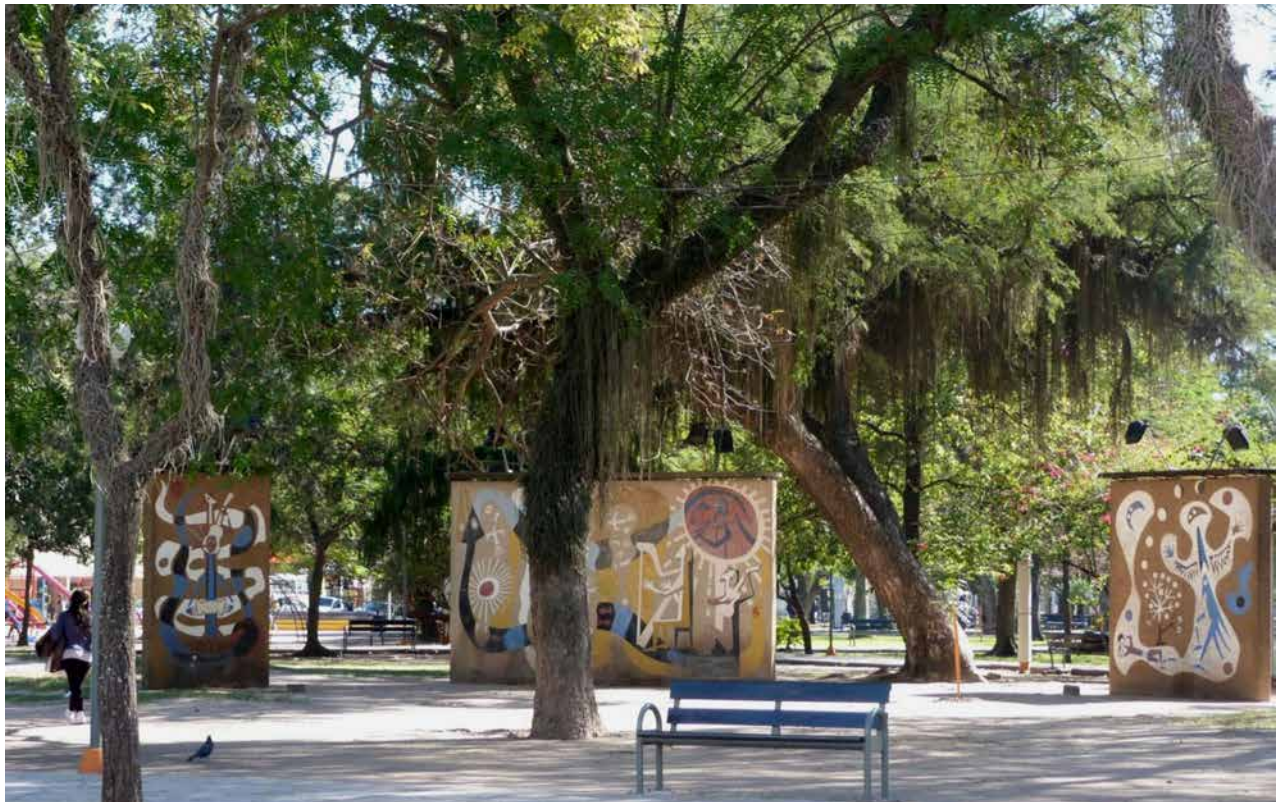
Figura 3: Obra mural “Génesis del Chaco”. Autor: Raúl Monsegur. Plaza central 25 de Mayo de 1810. Resistencia, Chaco, Argentina