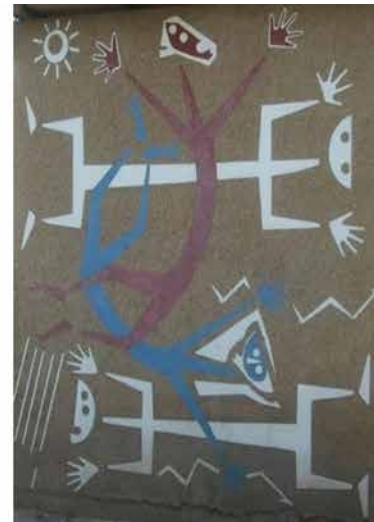
Figura 6: "Génesis del Chaco". Vista del mural desde el interior de la plaza 25 de Mayo de 1810. Resistencia, Chaco, Argentina.