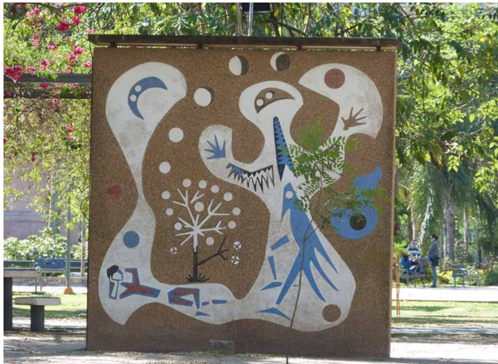
Figura 5: “Génesis del Chaco”. Plano murario derecho. Frente: Avenida 9 de julio, Resistencia, Chaco, Argentina