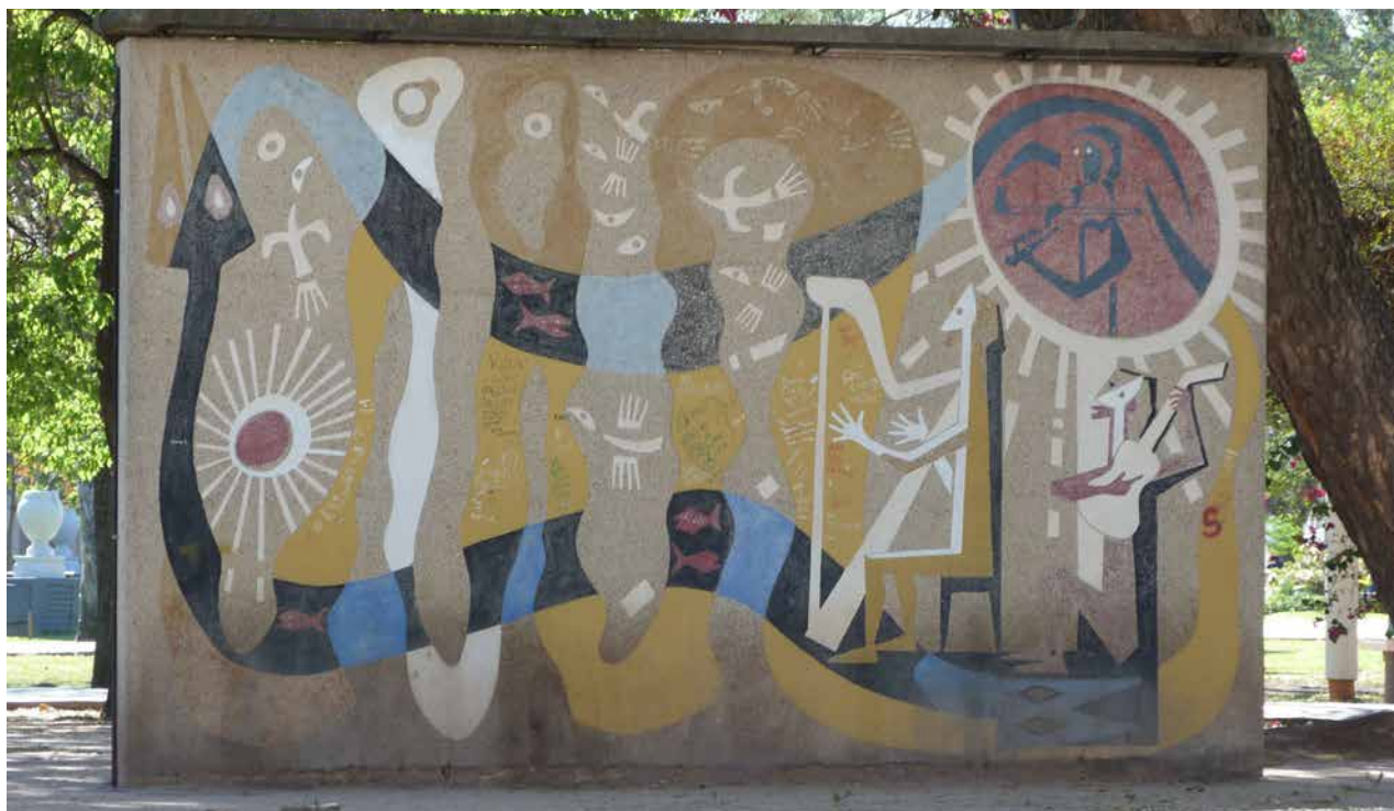
Figura 4: “Génesis del Chaco”. Plano murario central. Frente: Avenida 9 de julio, Resistencia, Chaco, Argentina