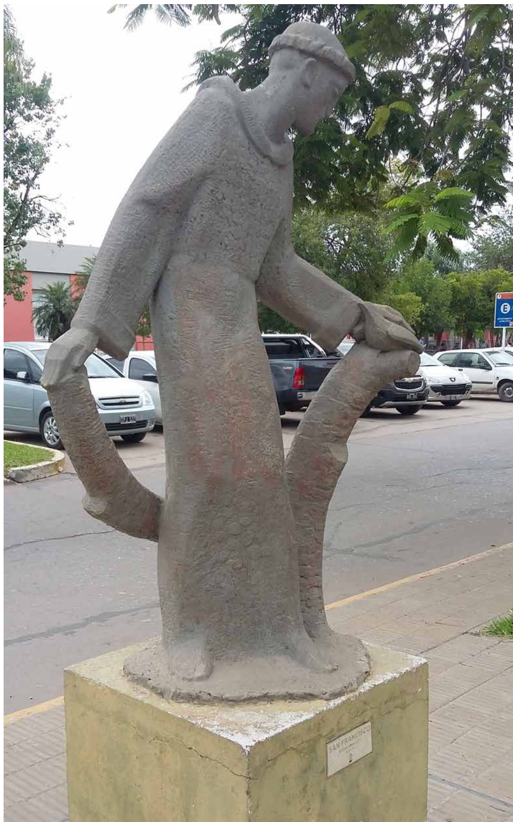
Figura 2: San Francisco. Autor: Carlos de la Cárcova. Brown, núm. 500, Resistencia, Chaco, Argentina

cas, teatrales y musicales. Si bien El Fogón ha sido autodenominado como institución, museo, club, casa de la amistad, estilo de vida , es posible también entenderlo en clave de las relaciones que mantenía con el contexto social y cultural