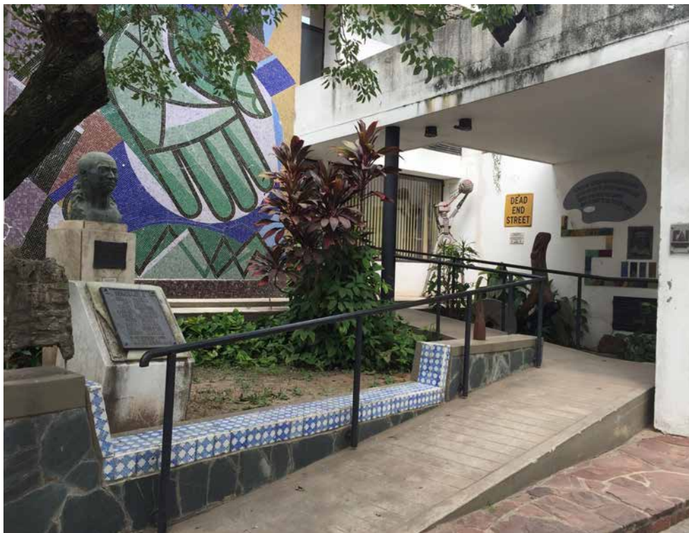
Figura 1: Frente de El Fogón de los Arrieros . Brown núm. 350 Resistencia, Chaco, Argentina

6. El emplazamiento de obras artísticas en la ciudad puede ordenarse en distintas etapas. Es así que a la primera la identificamos como la etapa de los monumentos conmemorativos, que se dio entre la primera década del 1900 hasta 1960. Corresponden a esta etapa el emplazamiento del Monumento Dónovan (1910), La loba (1920), Obelisco de los Inmigrantes (1928), Monumento al Gral. San Martín (1945), Busto de Manuel Belgrano (1953) (Sudar, 2008; Romagnoli, 1989, 2003).